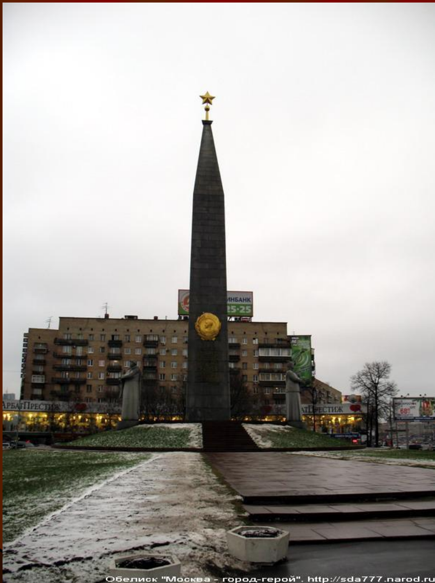
Обелиск "Москва - город-герой".

В битве под Москвой развеялся миф о непобедимости немецкой армии