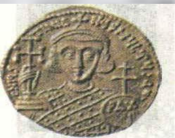
Византийский со- лид (золотая моне- та) VIII в.