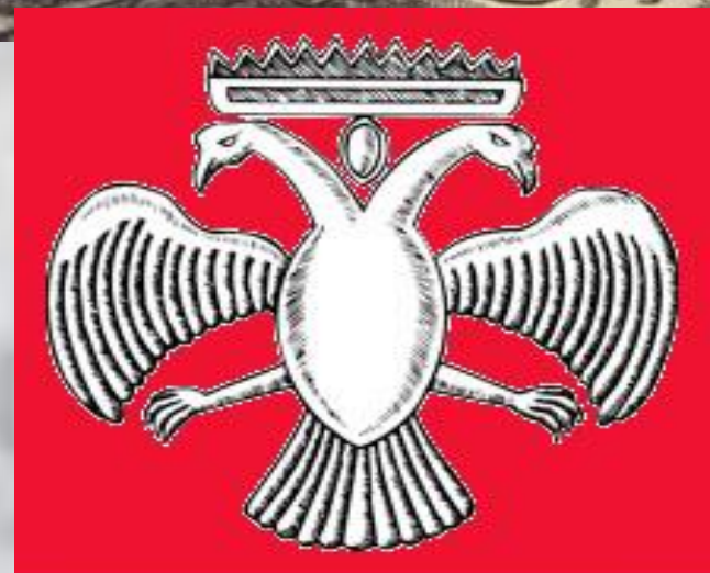
Герб Византии (Византийской империи) XIII-XV вв.