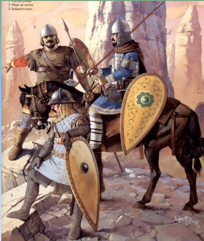
1- кавалерист; 2 - оруженосец; 3 - пехотинец.