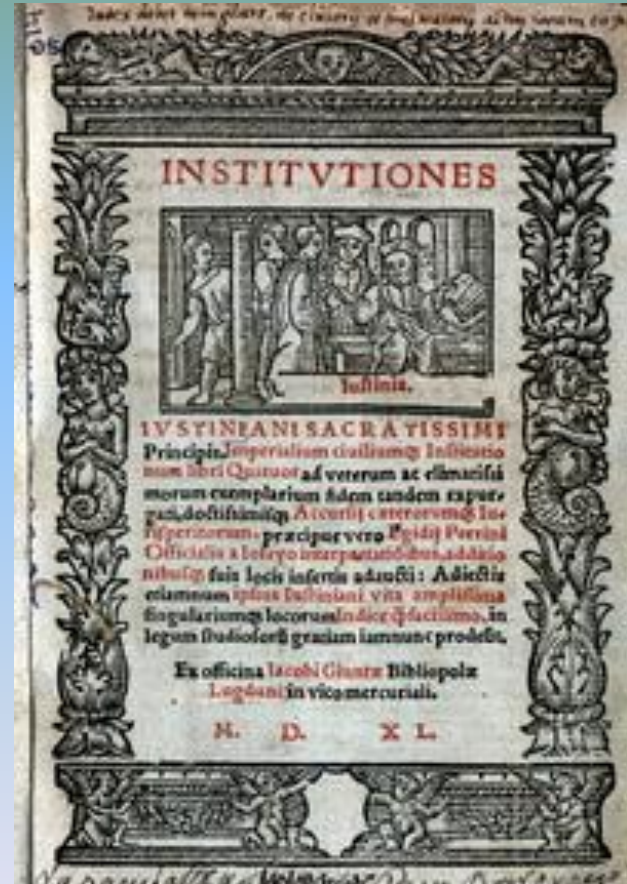
СВОД ЗАКОНОВ ЮСТИНИАНА

Создан свод Юстиниана, где были собраны и упорядочены все законы; Расширена территория империи, присоединены земли С. Африки, часть Испании, Италию; Строились храмы и