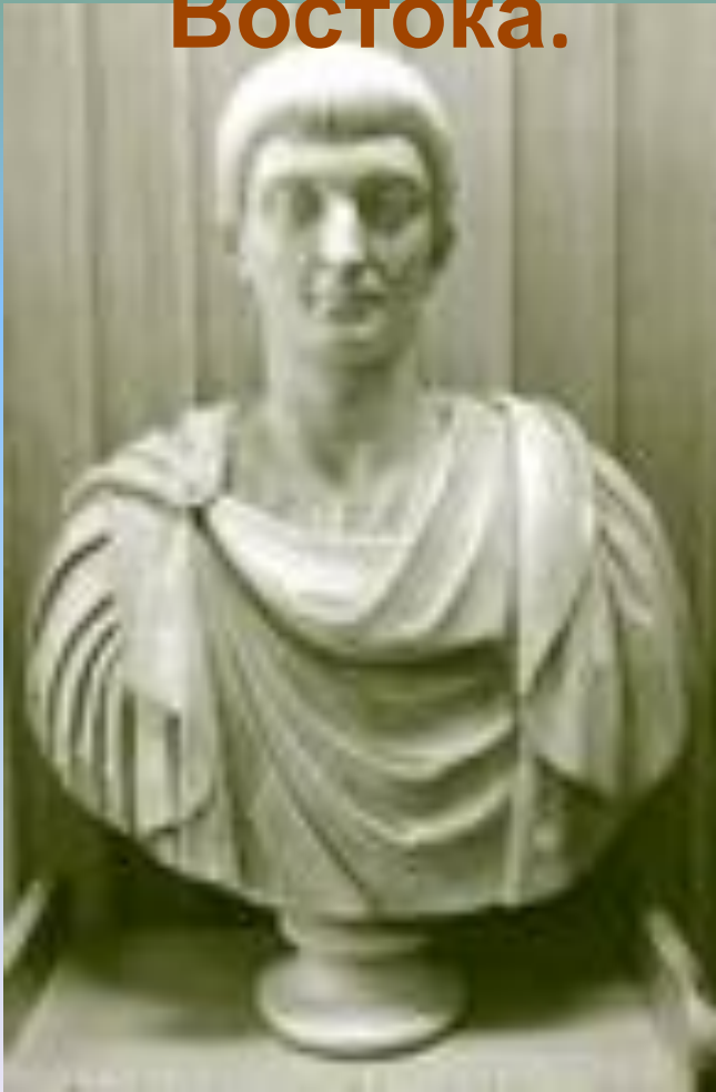
Император Константин I

• Император Константин, принявший в 313 г. христианство, в 330 провозгласил Константинополь (Византий) новой столицей Римской империи; Император Феодосий в 395 г. разделил Римскую империю на Западную и Восточную.