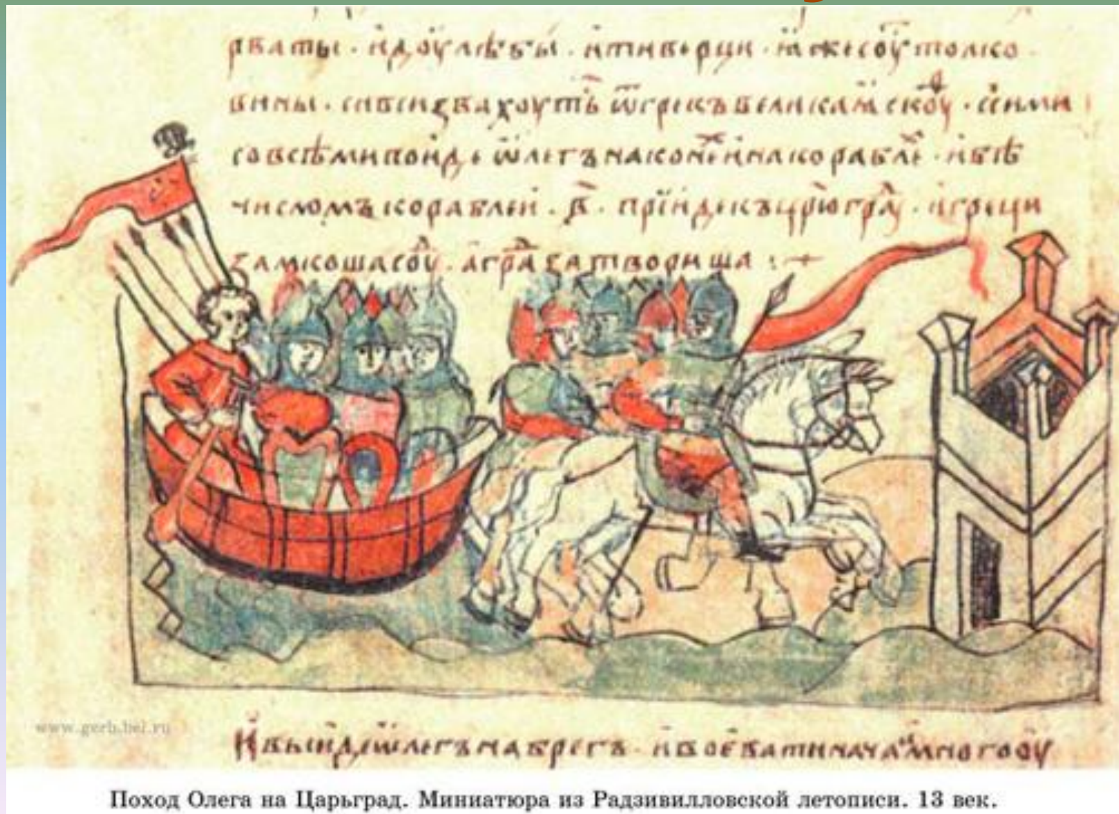
Поход Олега на Царьград. Миниатюра из Радзивилловской летописи. 13 век.