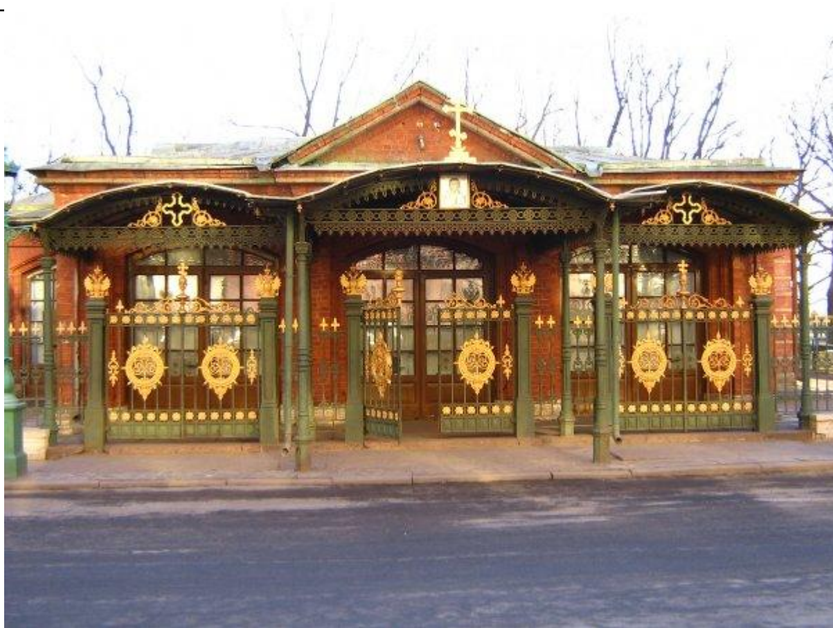
домик Петра 1