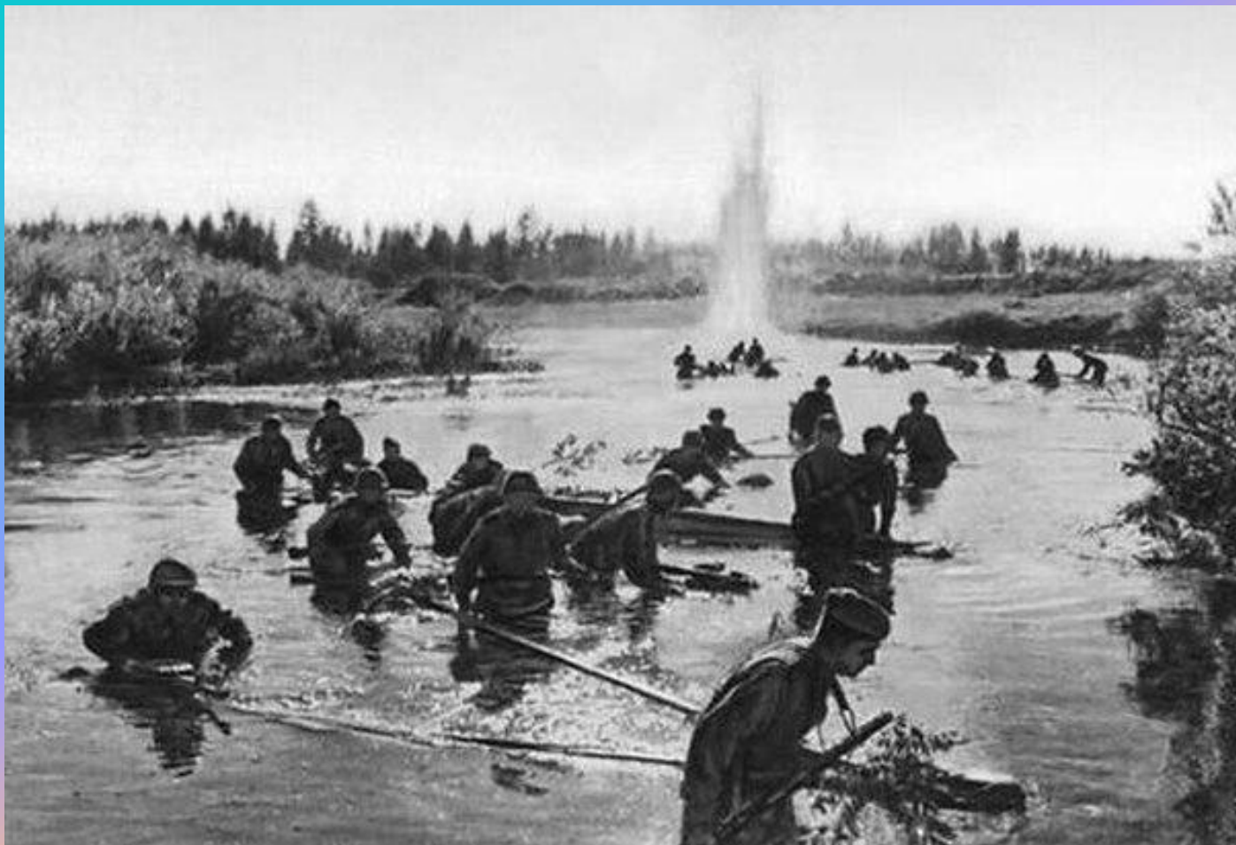
Форсирование Днепра 1943 г.

В годы Великой Отечественной войны гидрологи помогали преодолевать водные рубежи, болота.