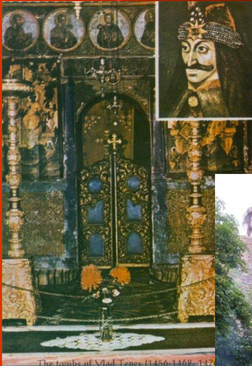
The tombs of Vlad Tepes (1456-1469, 1476-1477)