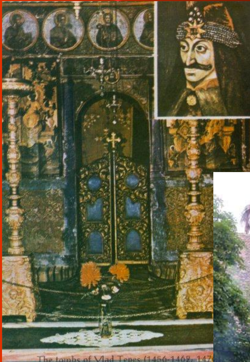
The tombs of Vlad Tepes (1456-1469, 1476-1477)