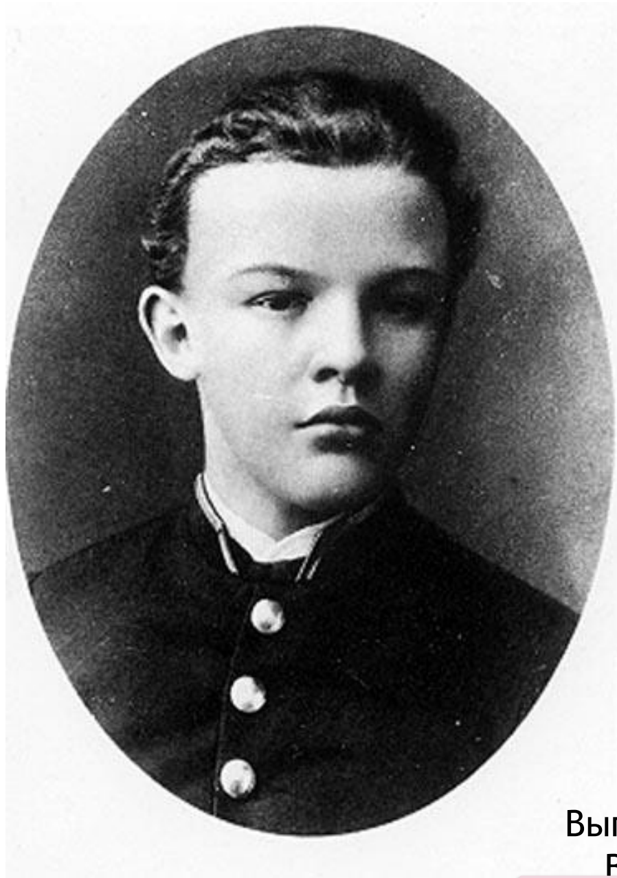
Выпускник Симбирской гимназии Владимир Ульянов. 1887 год.