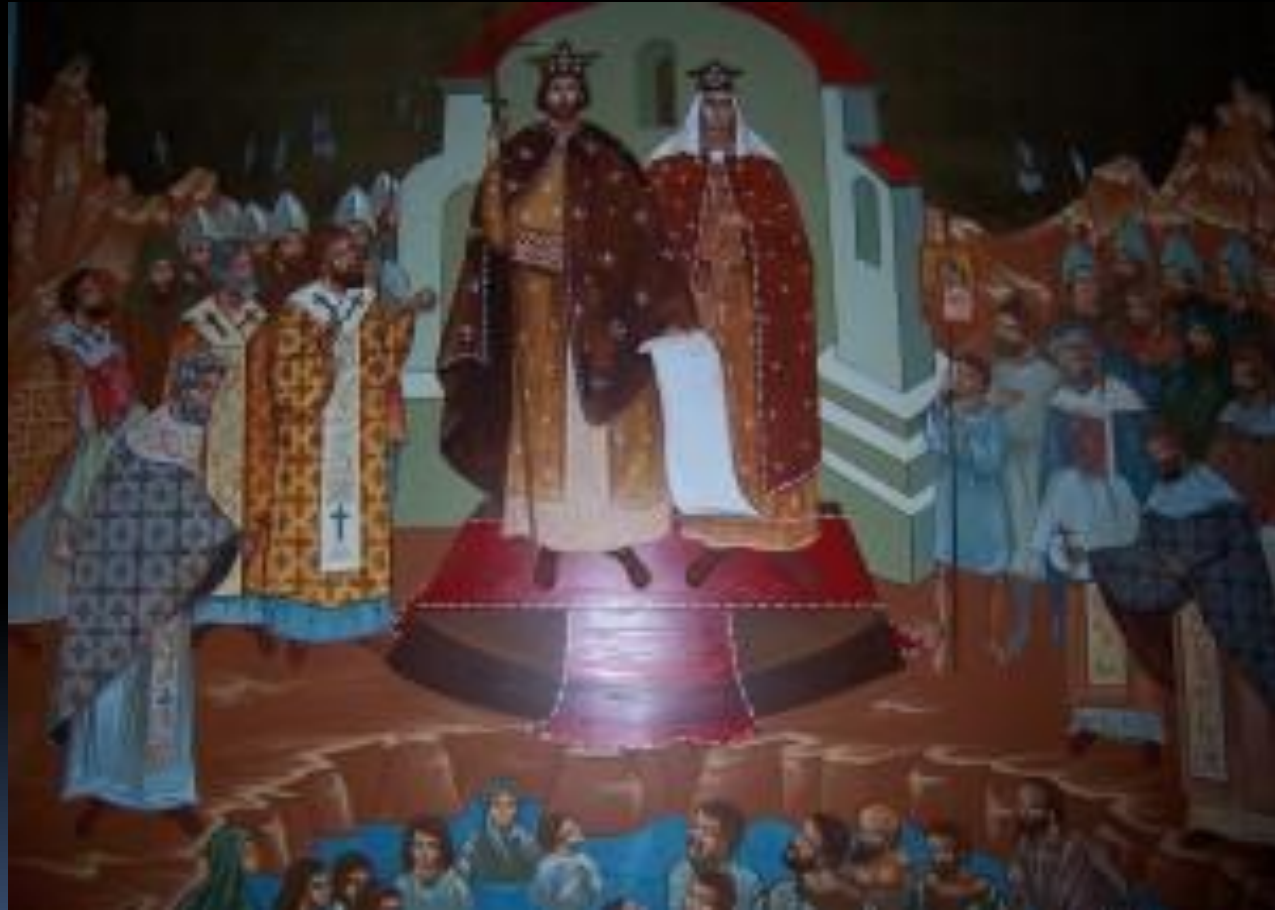
Великий князь Владимир и княгиня Ольга крестят Русь Киевскую в водах Днепра (икона)

Крестившись сам, в 988 году Владимир призвал на берег Днепра всех киевлян, которые приняли новую веру.