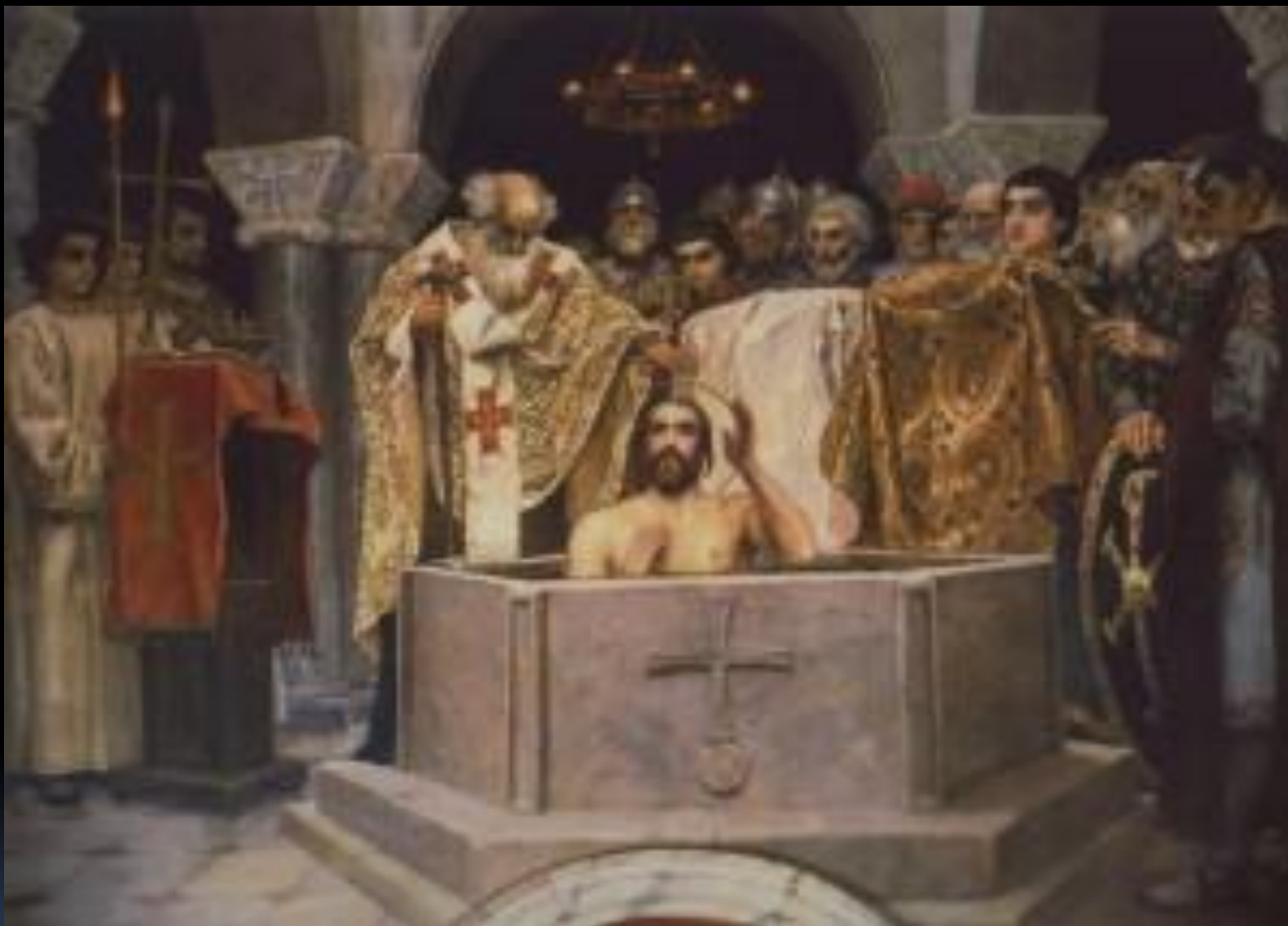
Крещение Святого князя Владимира В. Васнецов