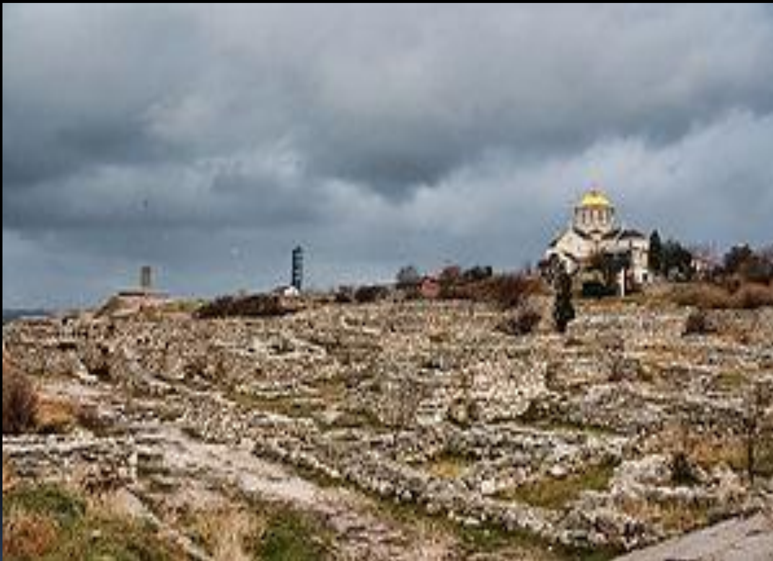
Руины Херсонеса (Корсунь) и собор Св. Владимира