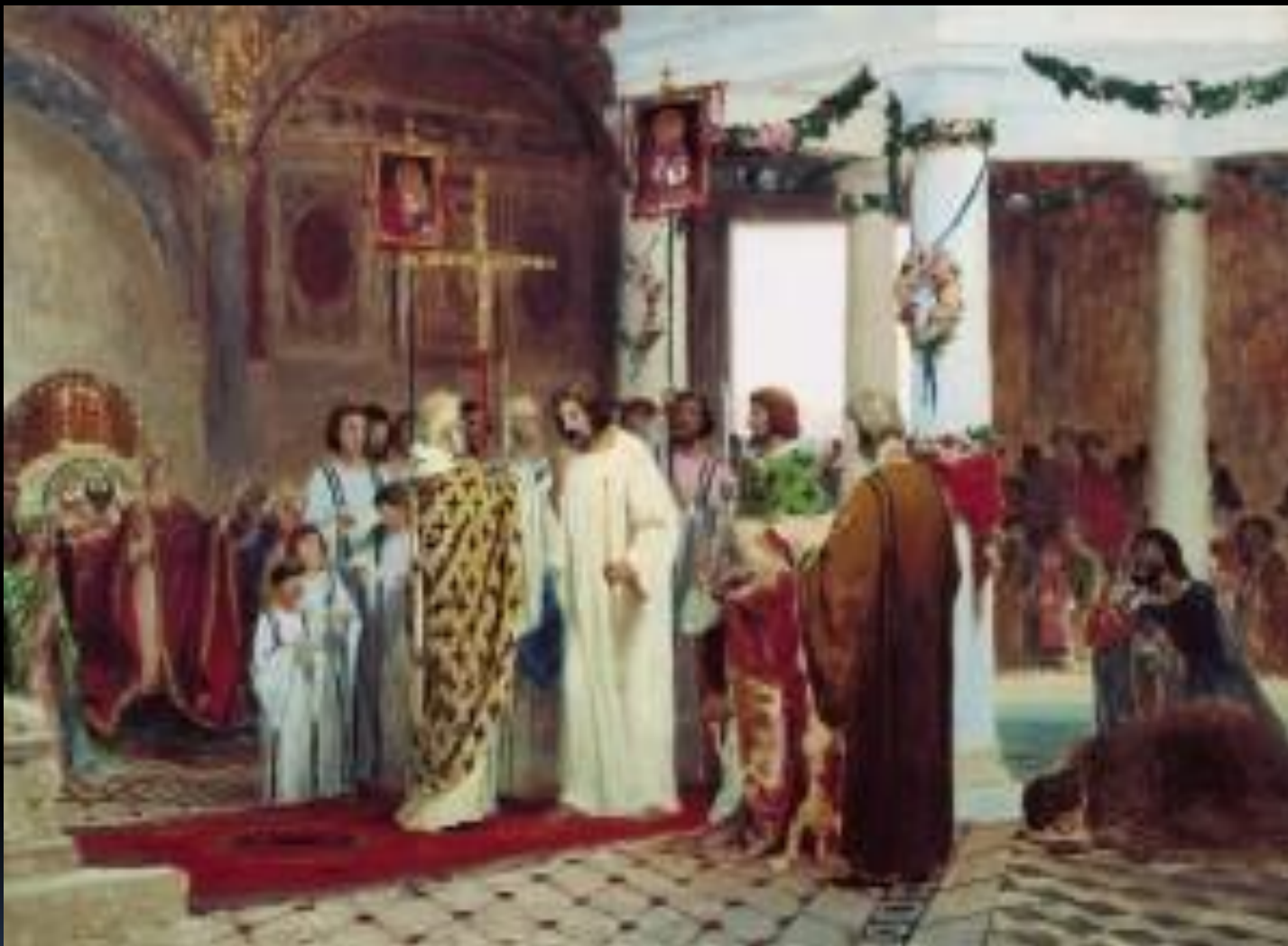
Крещение князя Владимира. Бронников Фёдор