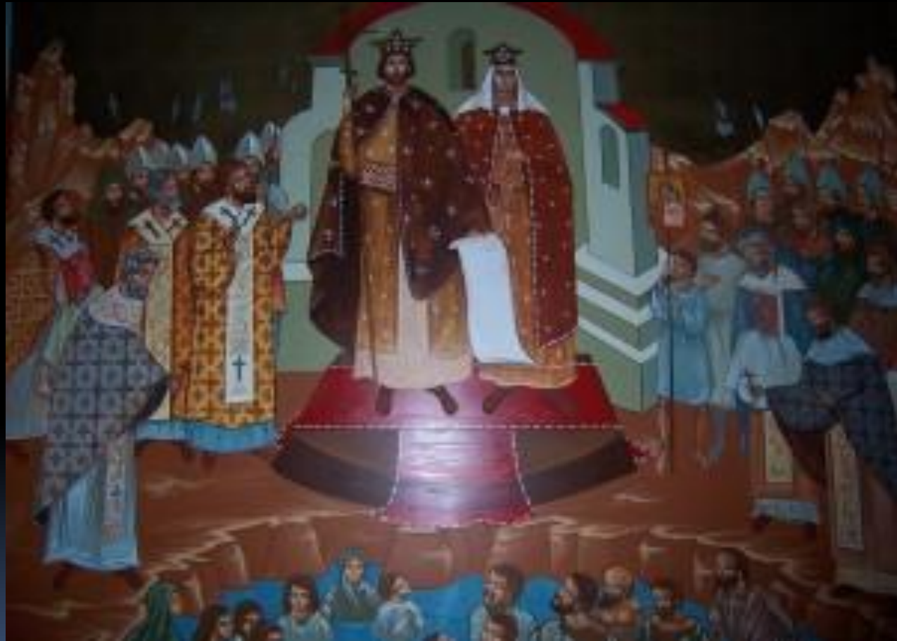
Великий князь Владимир и княгиня Ольга крестят Русь Киевскую в водах Днепра (икона)

Крестившись сам, в 988 году Владимир призвал на берег Днепра всех киевлян, которые приняли новую веру.