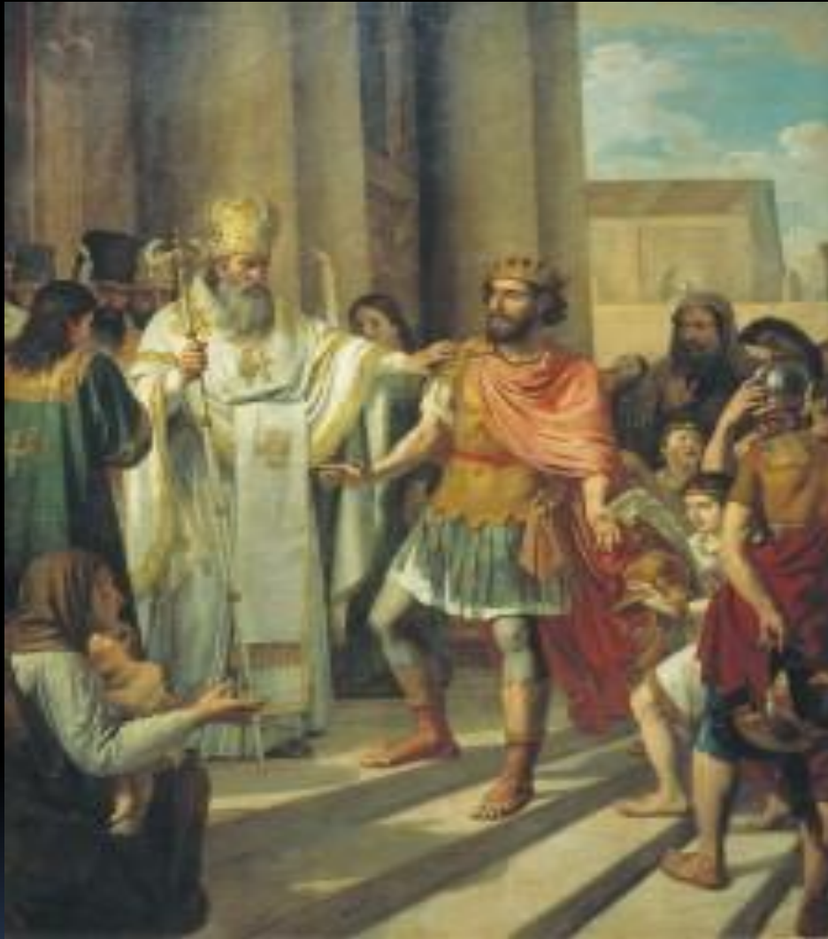
Крещение великого князя Владимира в Корсуни Худ. А. Иванов. 1829 г.