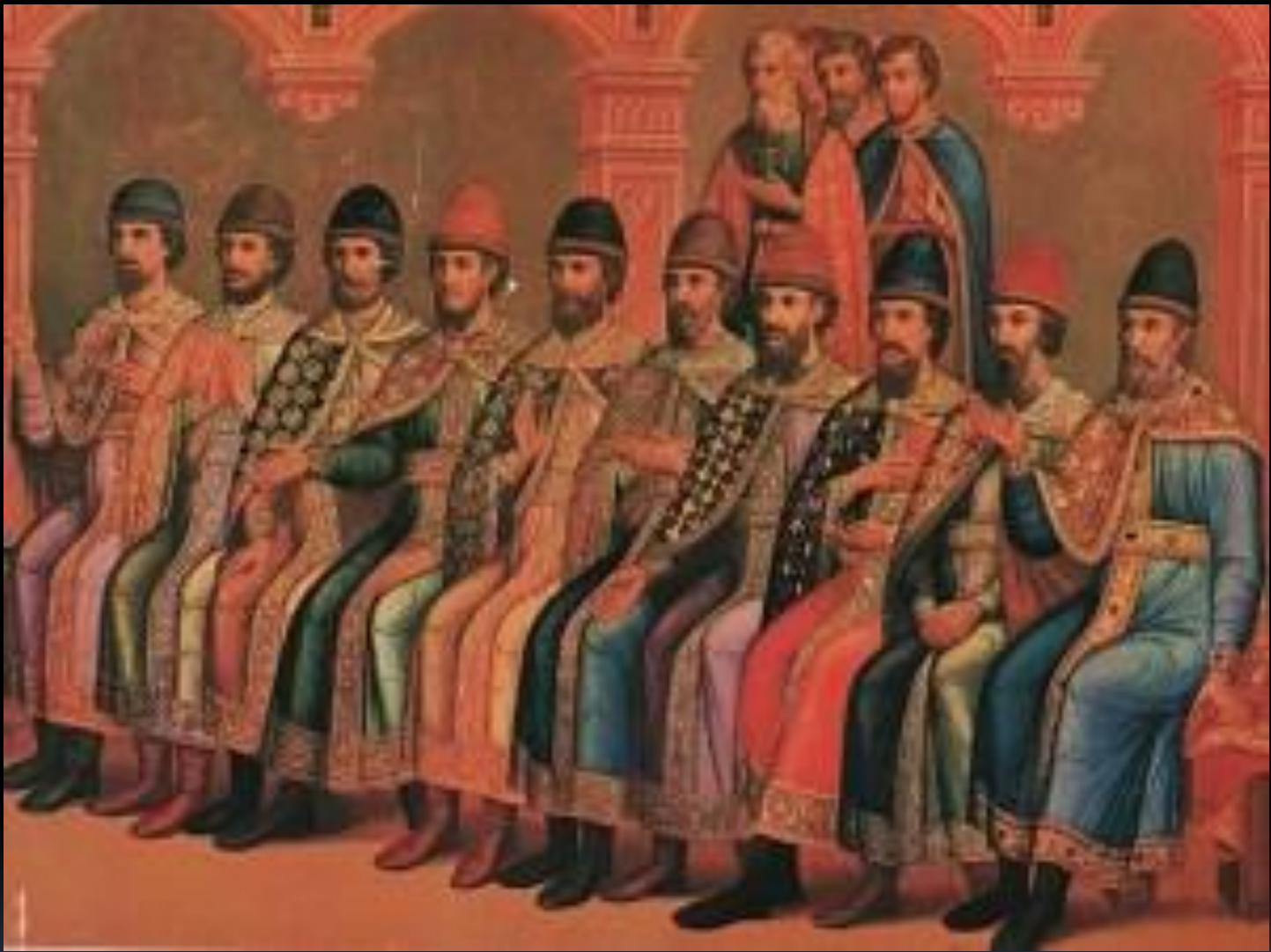
У князя Владимира было 13 сыновей и 10 дочерей. Великий князь Владимир Святославович с сыновьями. Роспись восточной стены Грановитой палаты. 1882