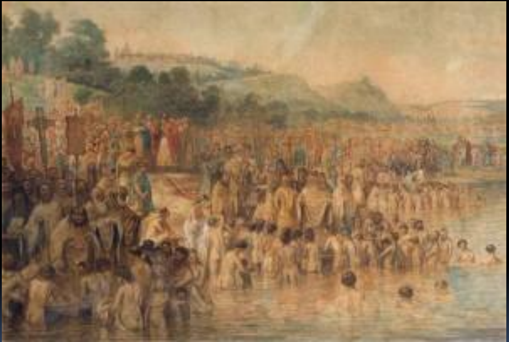
Крещение Руси. В.Г.Перов