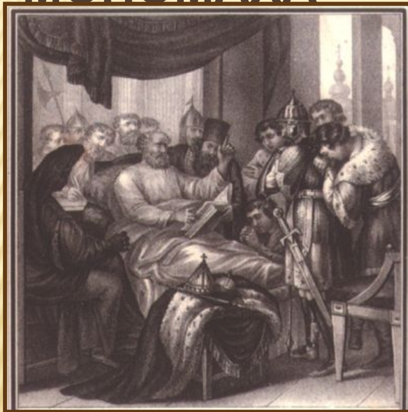
Завещание Владимира Мономаха детям. Литография по рисунку художника Бориса Чорикова. 1836 год

Знакомство с текстом исторического источника «Поучение Владимира Мономаха», подготовка ответов на вопросы к нему.