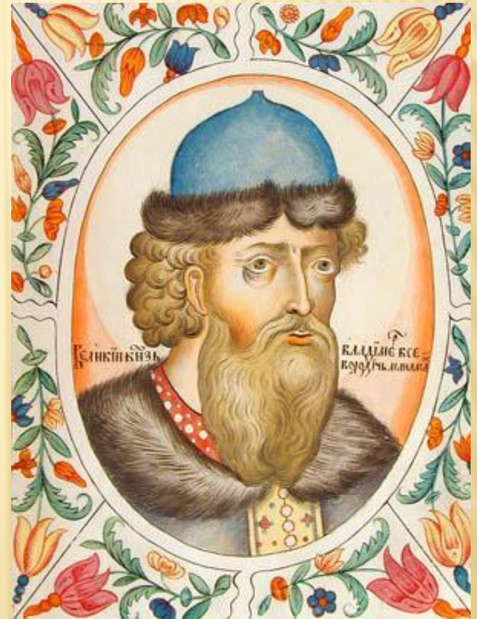
Великий князь Владимир Всеволодович Мономах. Портрет из царского титулярника. 1672 год