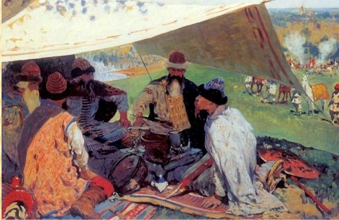
Сергей Иванов "Русские князья заключают мир в Уветичах"