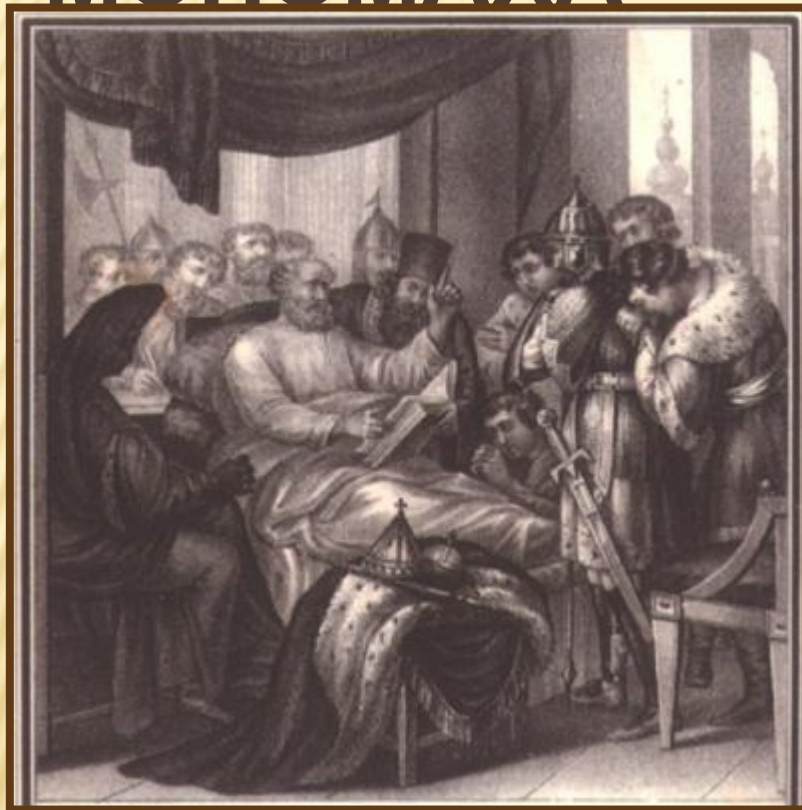
Завещание Владимира Мономаха детям. Литография по рисунку художника Бориса Чорикова. 1836 год

Знакомство с текстом исторического источника «Поучение Владимира Мономаха», подготовка ответов на вопросы к нему.