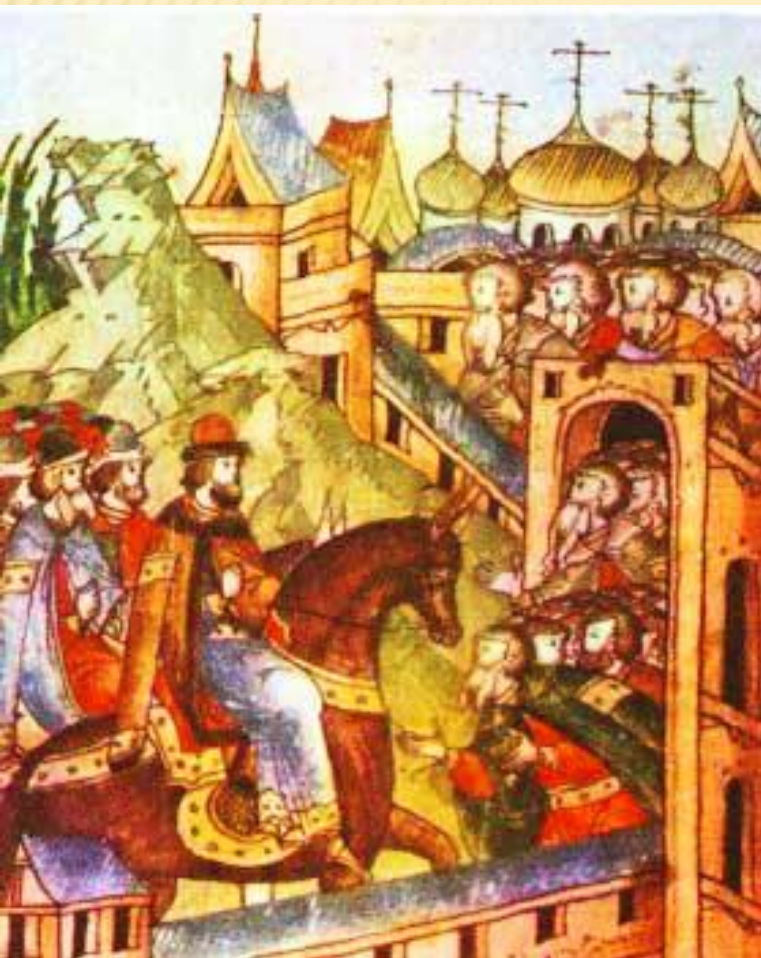
Приход Владимира Мономаха в Киев в 1113 г.