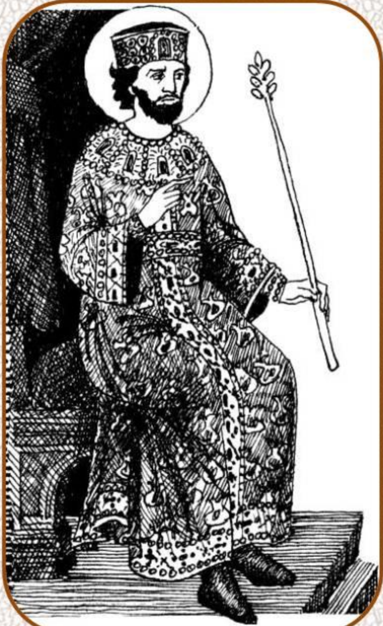
Владимир Мономах

Владимир изменил некоторые законы в «Русской Правде». По его правилам нельзя было брать слишком большие проценты за деньги, данные в долг. Более того, Владимир установил различие между должниками. Если человек попадет в долги оттого, что его имущество сгорит, или будет разграблено, или будет потеряно по каким-то другим обстоятельствам, то такому должнику давалась длительная отсрочка в платежах. Если же должник попадет в беду по своей вине, из-за пьянства или по