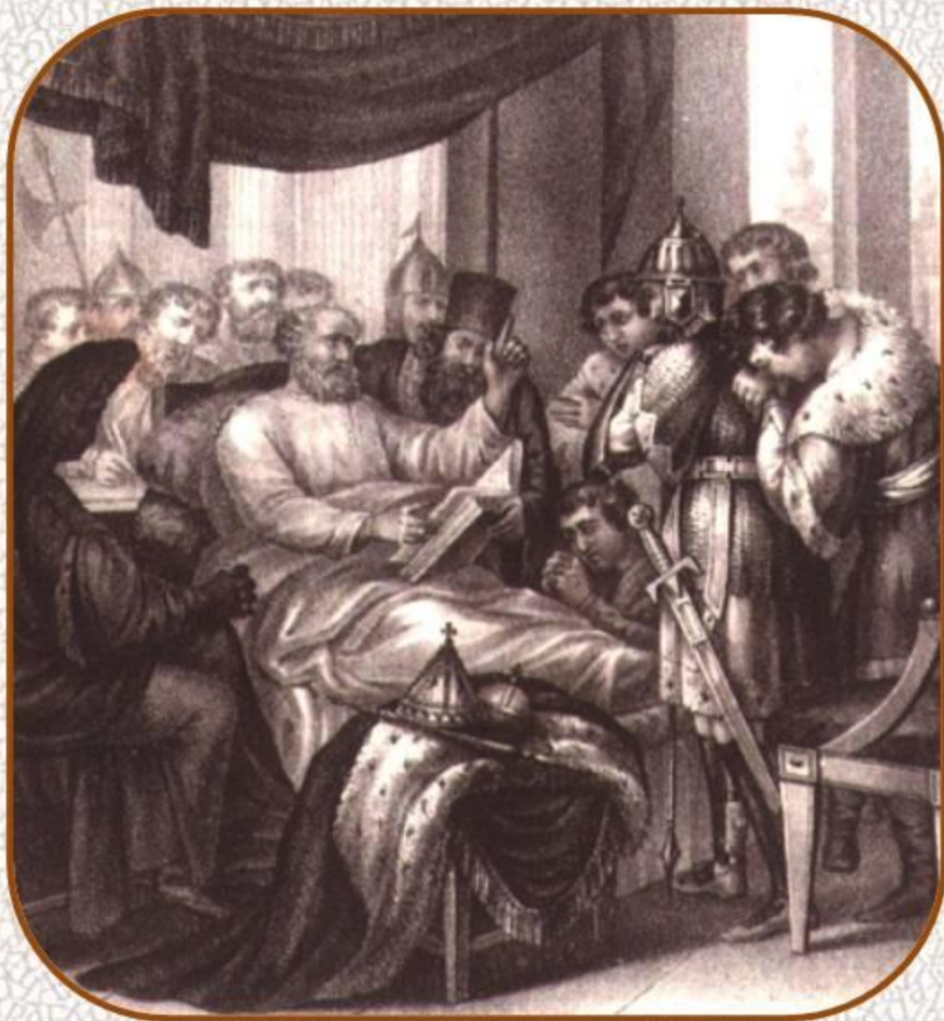
Завещание Владимира Мономаха детям. Литография по рисунку художника Бориса Чорикова. 1836 год

Из «Поучения» мы можем узнать о детстве и юности Владимира, о его верности православной вере, о его любви к церковной службе и молитве, заботе о своих подданных, об отношении к самому себе и другим людям.