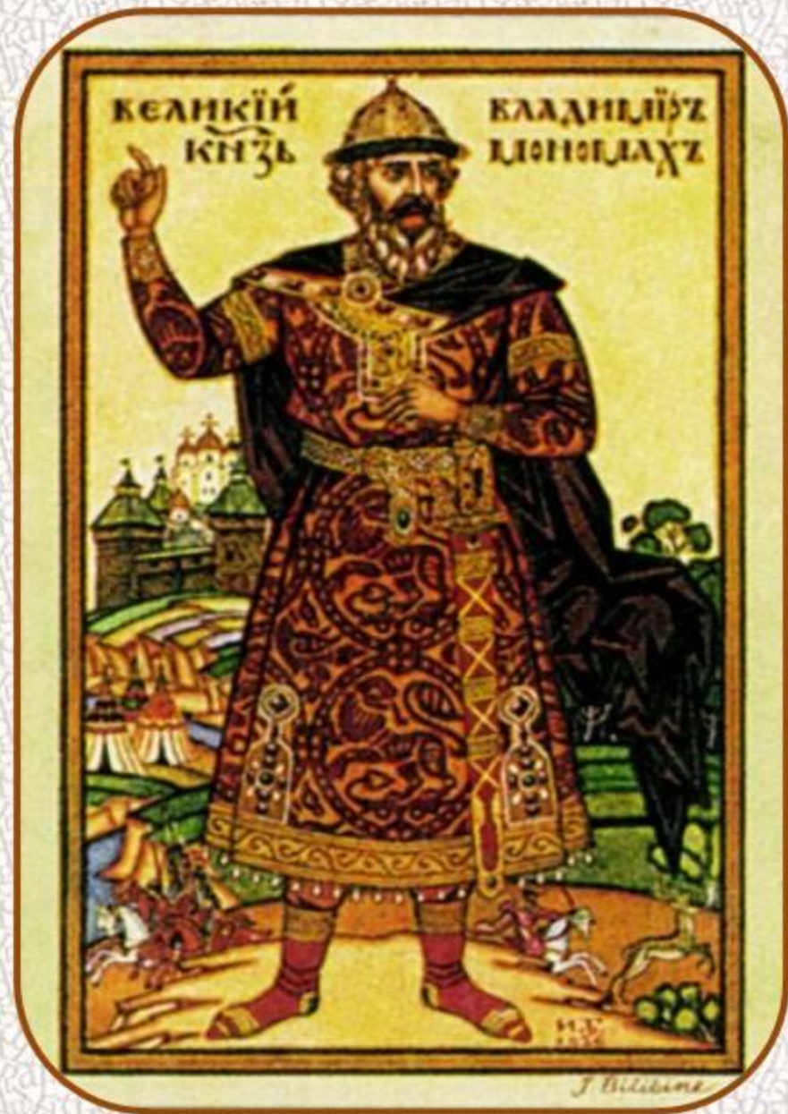
Билибин И.Я. Великий князь Владимир Мономах. 1926 г.

«Поправим зло, случившееся в Русской земле и среди нас, братьев, ибо нож в нас брошен. И если этого не поправим, то еще большее зло встанет среди нас, и начнет брат брата закалывать, и погибнет земля Русская, и враги наши половцы, придя, возьмут землю Русскую».