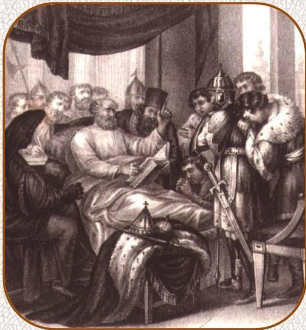
Завещание Владимира Мономаха детям. Литография по рисунку художника Бориса Чорикова. 1836 год

Из «Поучения» мы можем узнать о детстве и юности Владимира, о его верности православной вере, о его любви к церковной службе и молитве, заботе о своих подданных, об отношении к самому себе и другим людям.