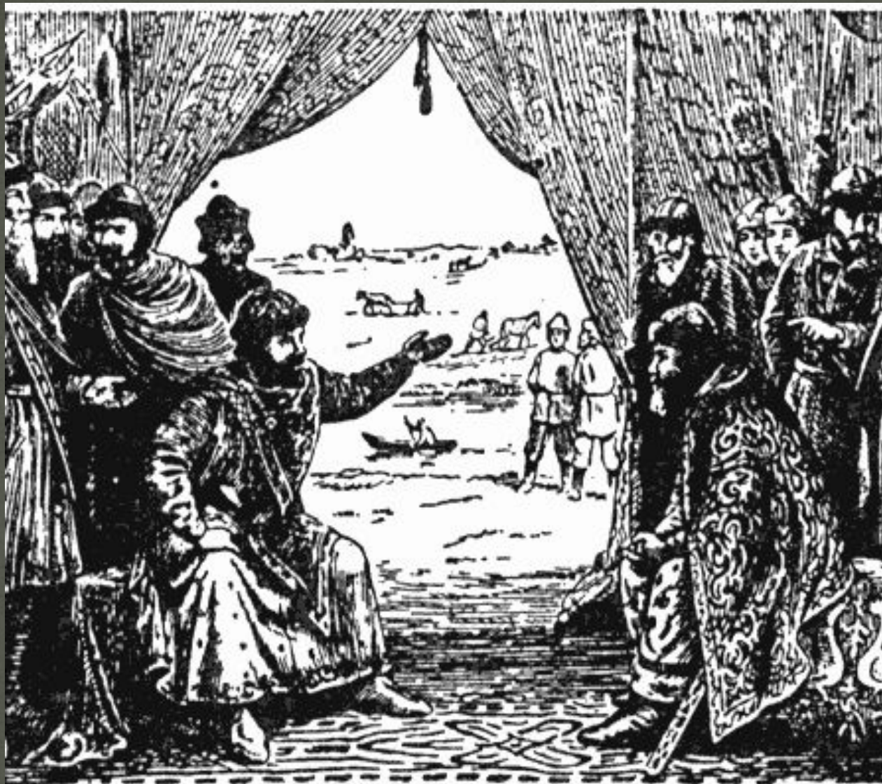
Владимир Мономах на совете князей.

На момент приглашения в Киев Мономах правил в своей вотчине Переяславле. Ему было уже 60 лет, и он успел проявить себя и как талантливый полководец, и как государственный деятель, и как человек высокой культуры. Владимира Мономаха уже давно знала Русская земля.