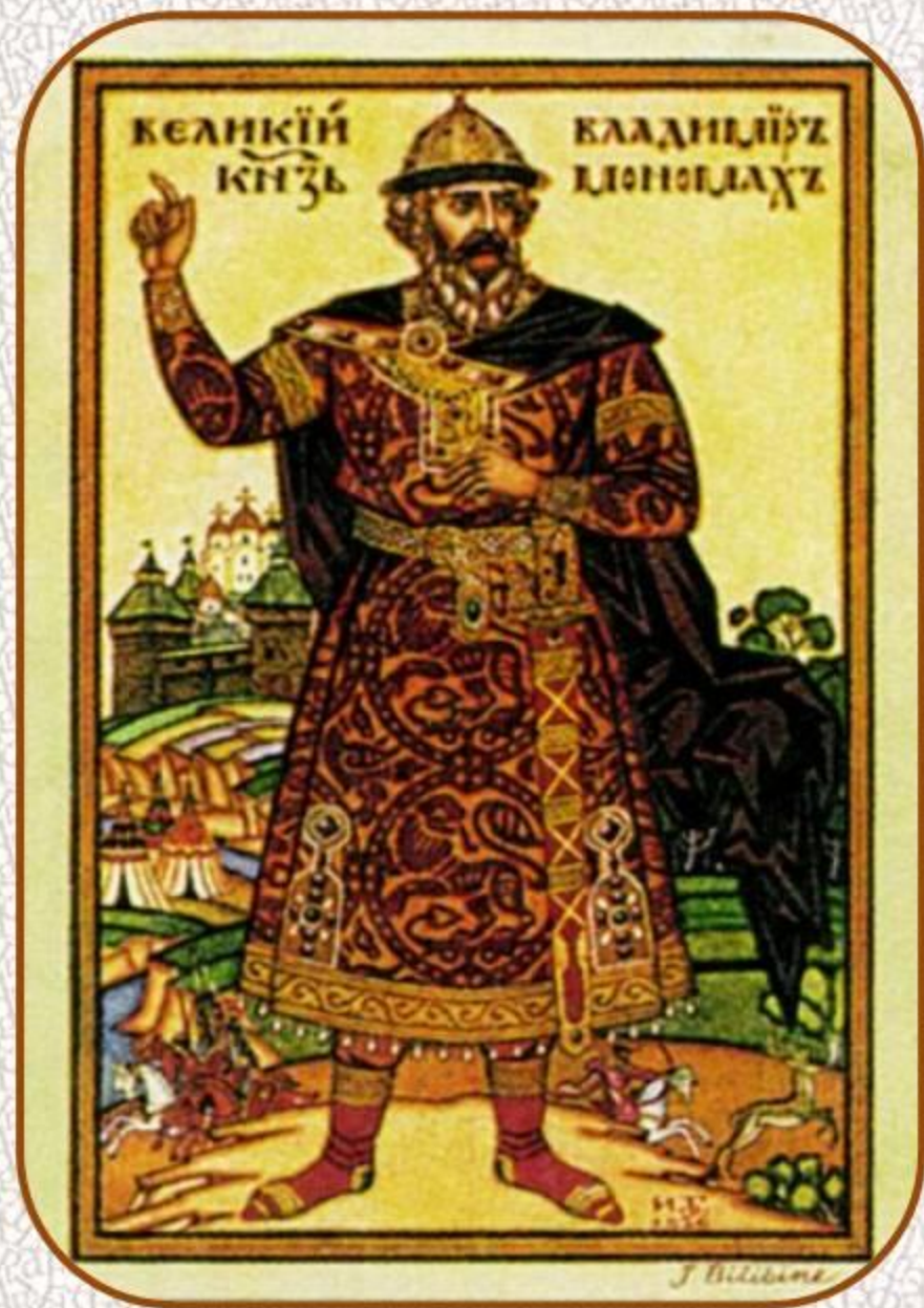
Билибин И.Я. Великий князь Владимир Мономах. 1926 г.

«Поправим зло, случившееся в Русской земле и среди нас, братьев, ибо нож в нас брошен. И если этого не поправим, то еще большее зло встанет среди нас, и начнет брат брата закалывать, и погибнет земля Русская, и враги наши половцы, придя, возьмут землю Русскую».