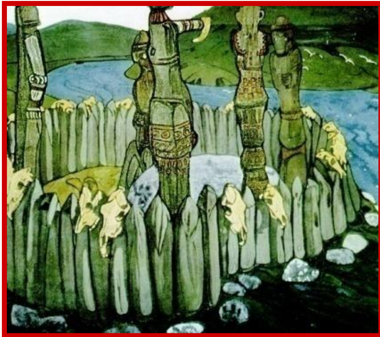
Н. Рерих. Языческое святилище