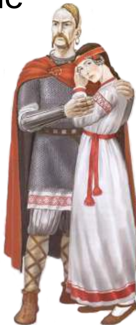
Малуша и Святослав