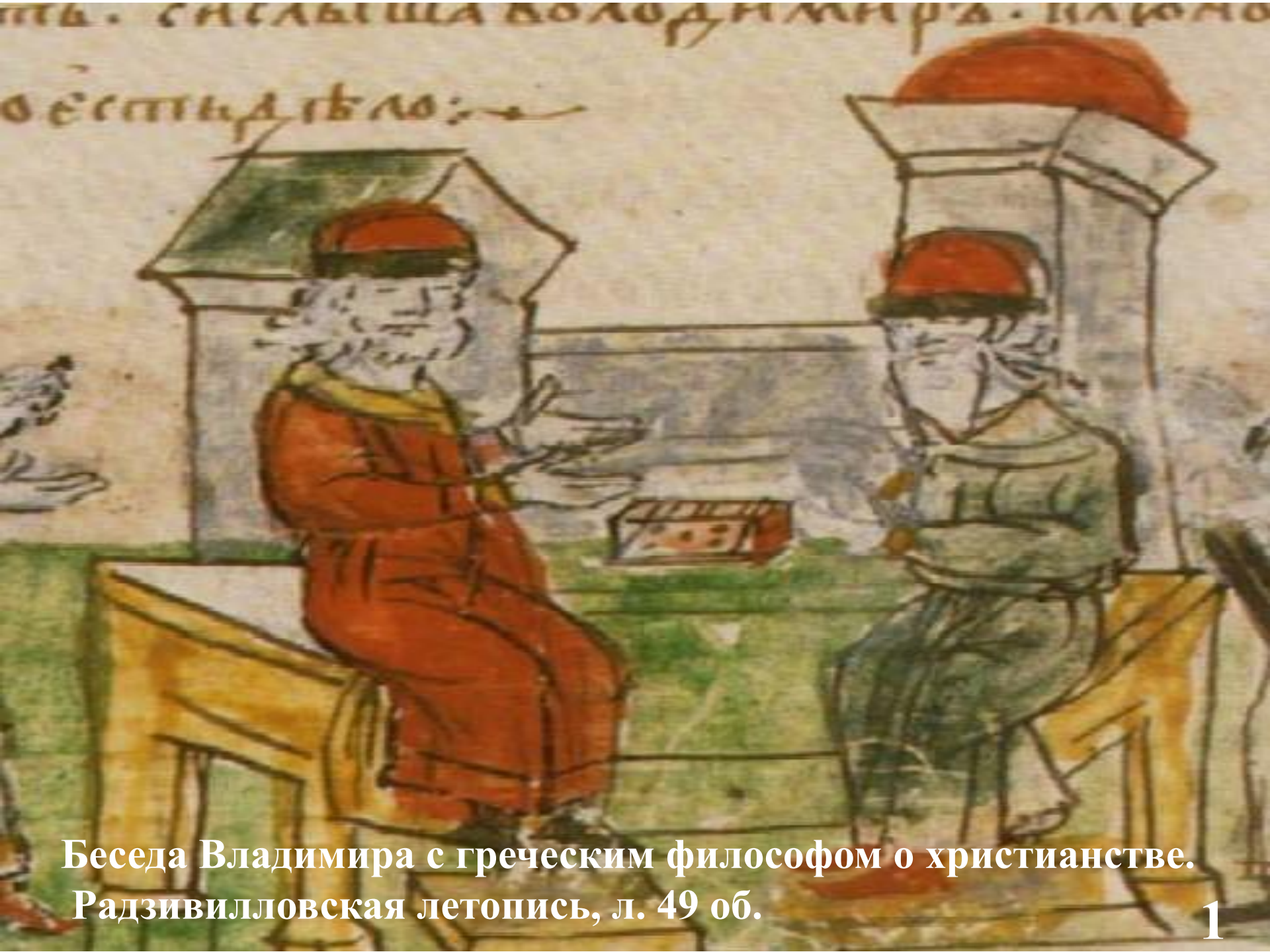
Беседа Владимира с греческим философом о христианстве. Радзивилловская летопись, л. 49 об.