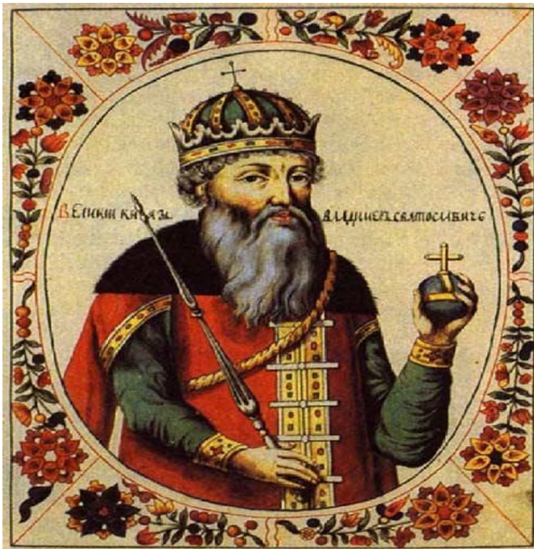
Владимир Святой (958-1015 гг.)