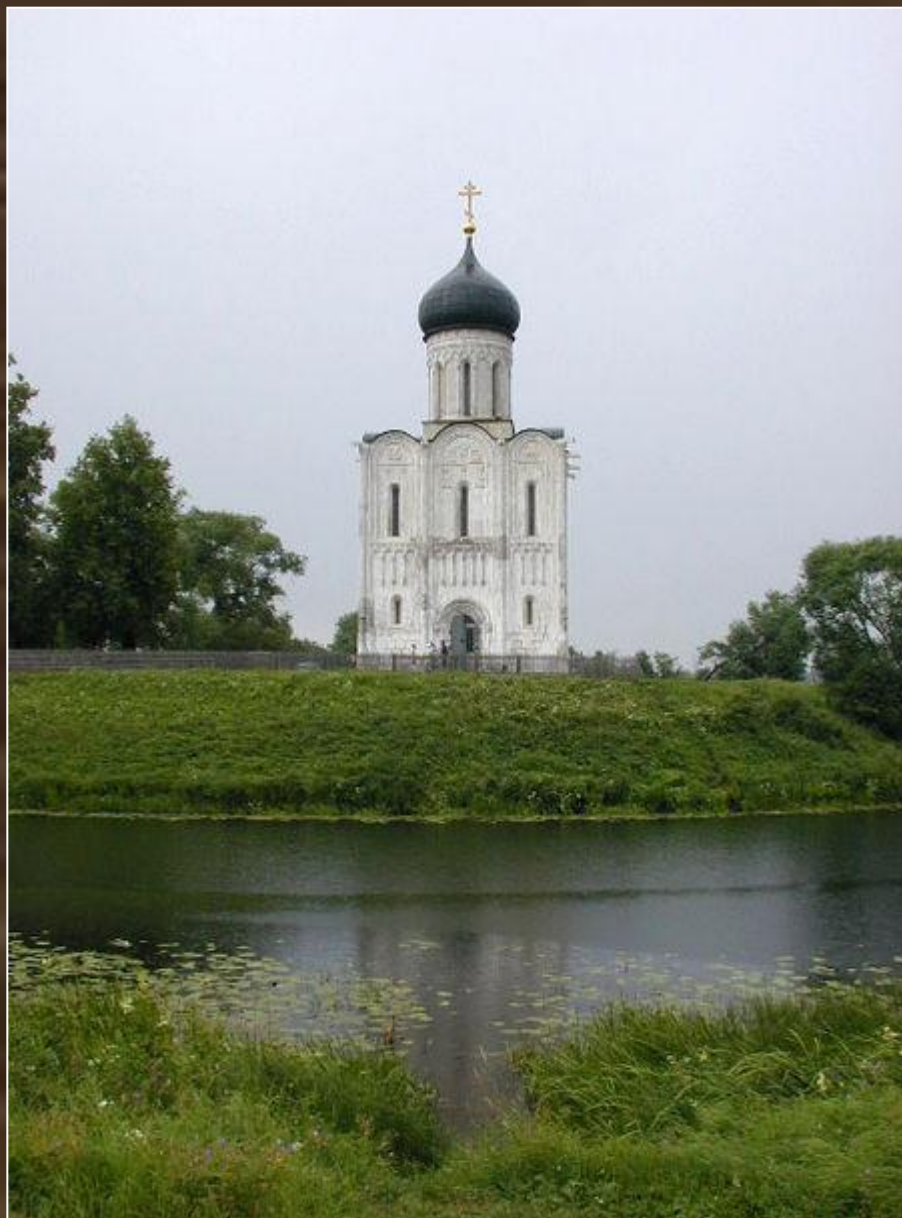
Церковь Покрова на Нерли. XII в.