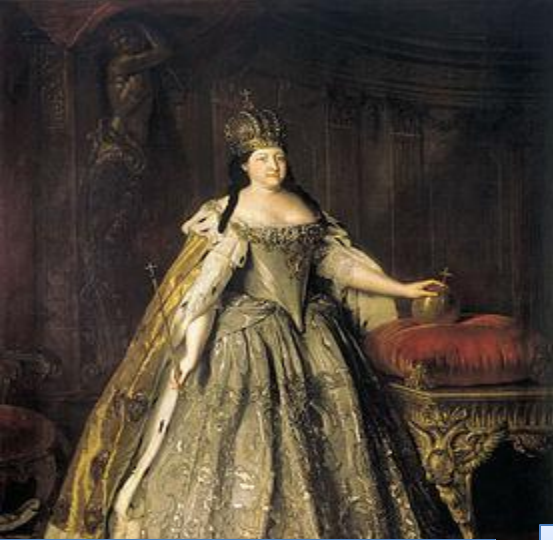
Анна Иоановна 1730-1740