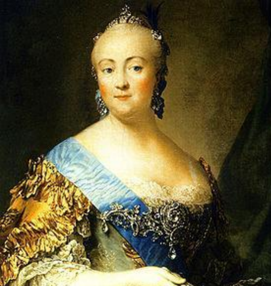
Елизавета Петровна 1741-1762