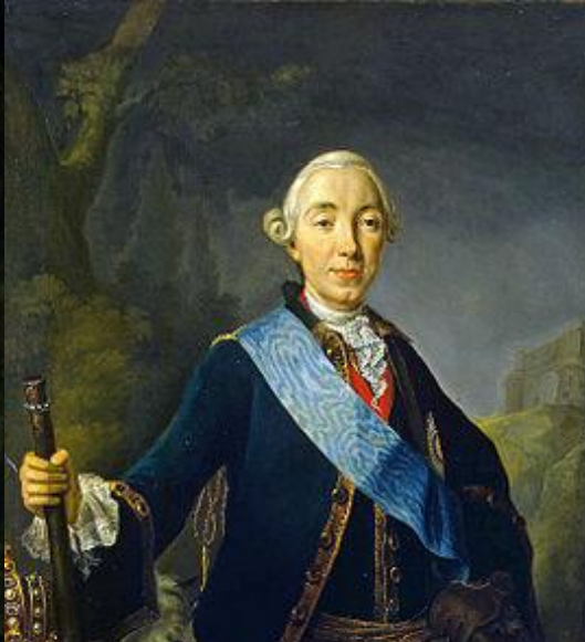
Петр III 1762