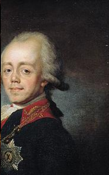
Павел I 1796 - 1801