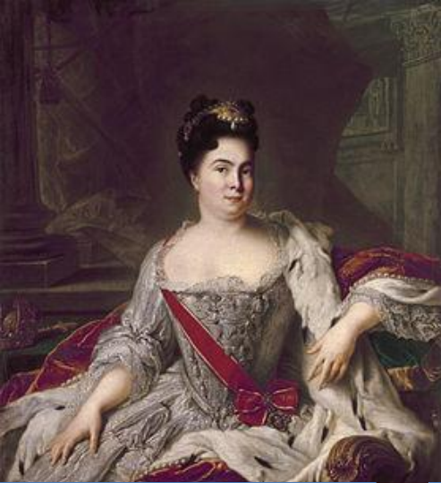
Екатерина I 1725-1727