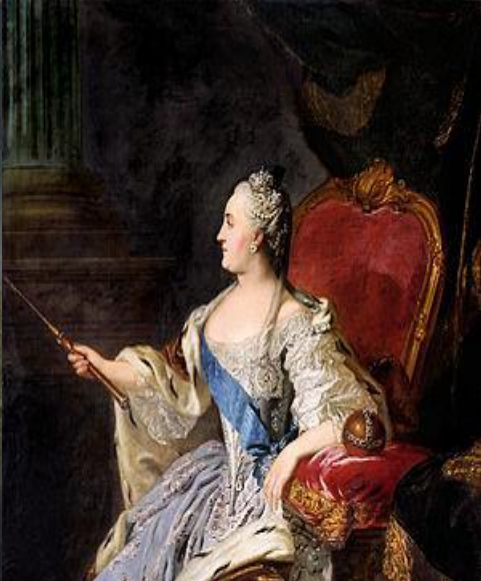
Екатерина II 1762-1796