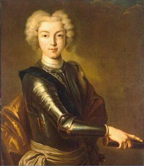
Петр II 1727 - 1730