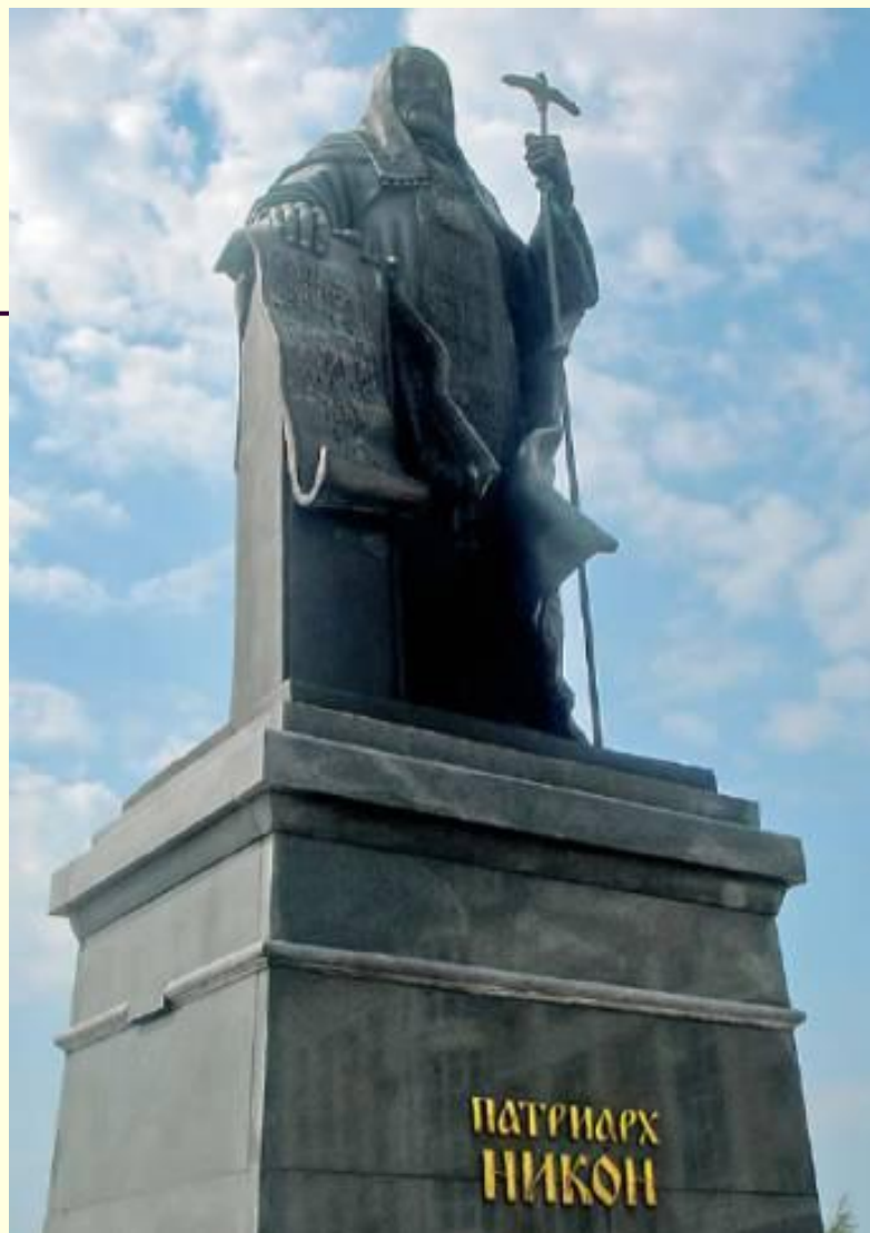
Памятник Патриарху Никону в Саранске. Скульптор Н.М.Филатов