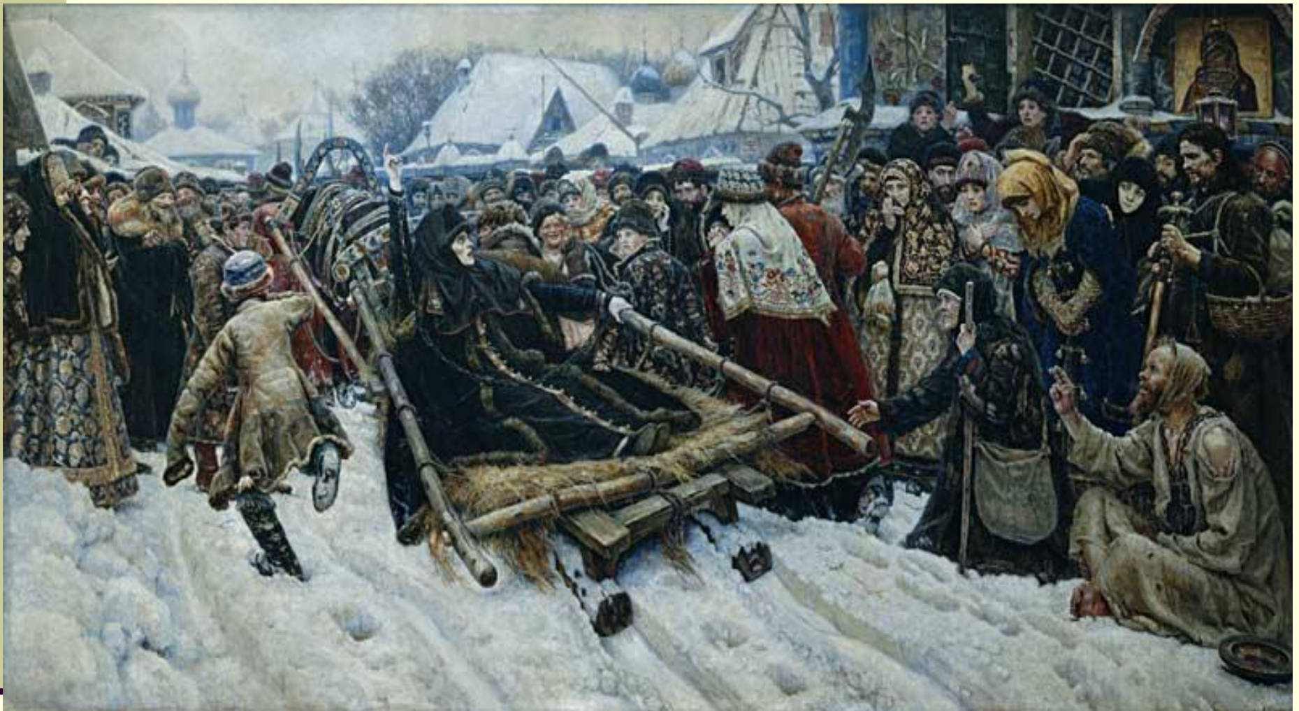
В.Суриков. Боярыня Морозова