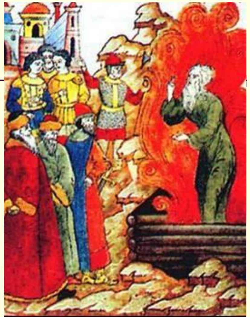
Сожжение протоппа Аввакума. Миниатюра к.17 в.