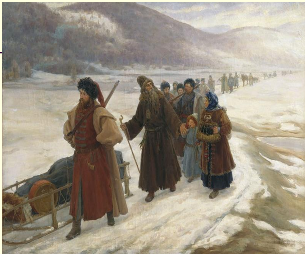
Протопоп Аввакум на пути в ссылку