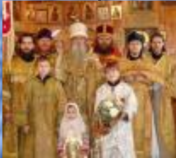
Община старообрядцев в г. Меленки- самая многочисленная в области