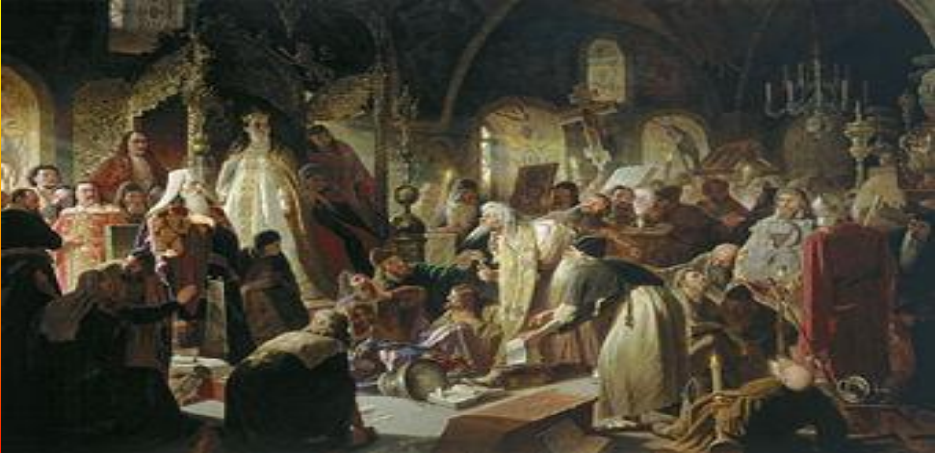
В.Перов Спор о вере