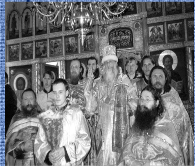
Во многих населенных пунктах Владимирского края проводятся богослужения в старообрядческих храмах.