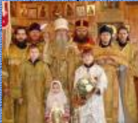
Община старообрядцев в г. Меленки- самая многочисленная в области