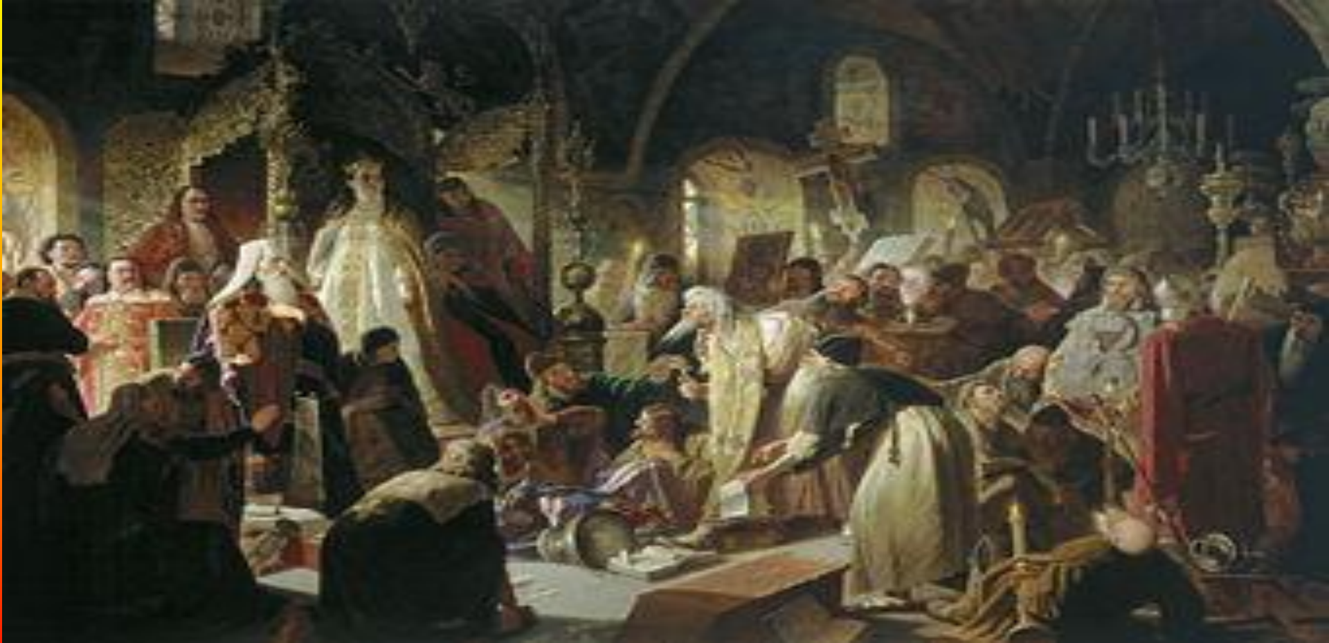
В.Перов Спор о вере