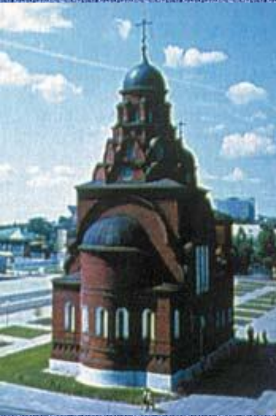
Старообрядческая Троицкая церковь Расположена в центре Владимира