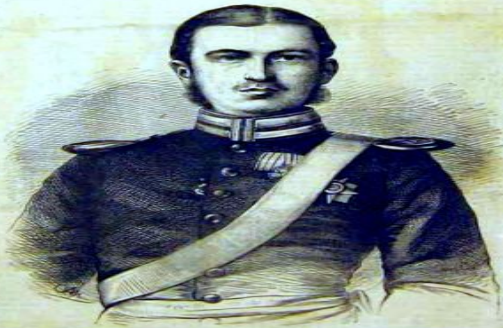
LE PRINCE CHARLES DE WÜRTTEMBERG, PRINCE DE SODMANE. D'après une photographie. Voir page 205.