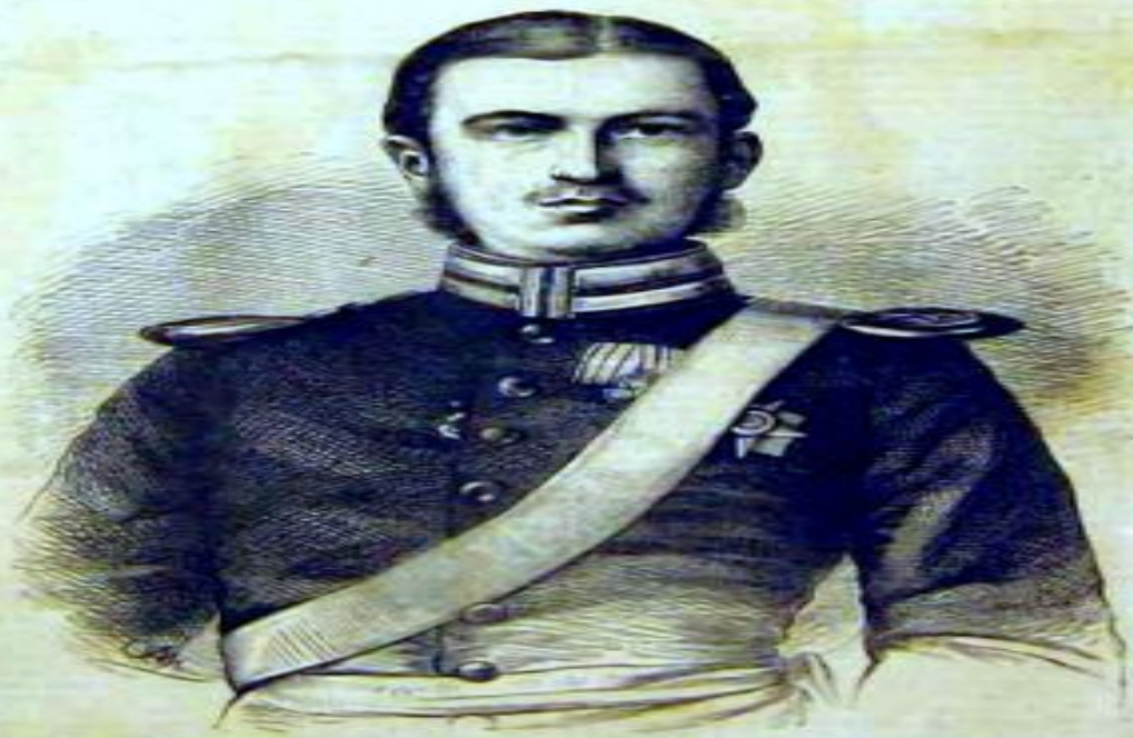
LE PRINCE CHARLES DE WÜRTTEMBERG, PRINCE DE ROUMANIE. D'après une photographie. Voir page 266.