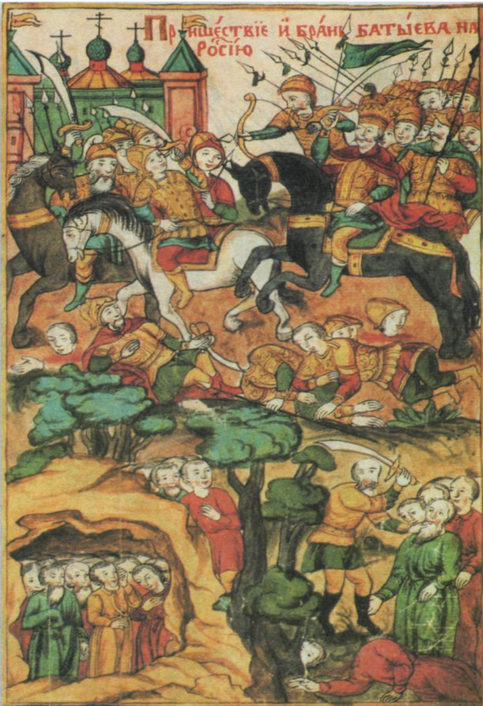
Нашествие хана Батыева на Русь. Миниатюра XVII в.