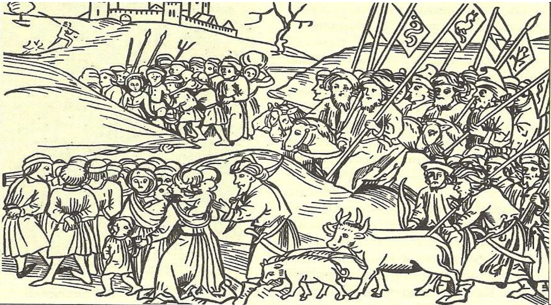
Угон русского полона в Орду. Миниатюра из венгерской хроники XV в.