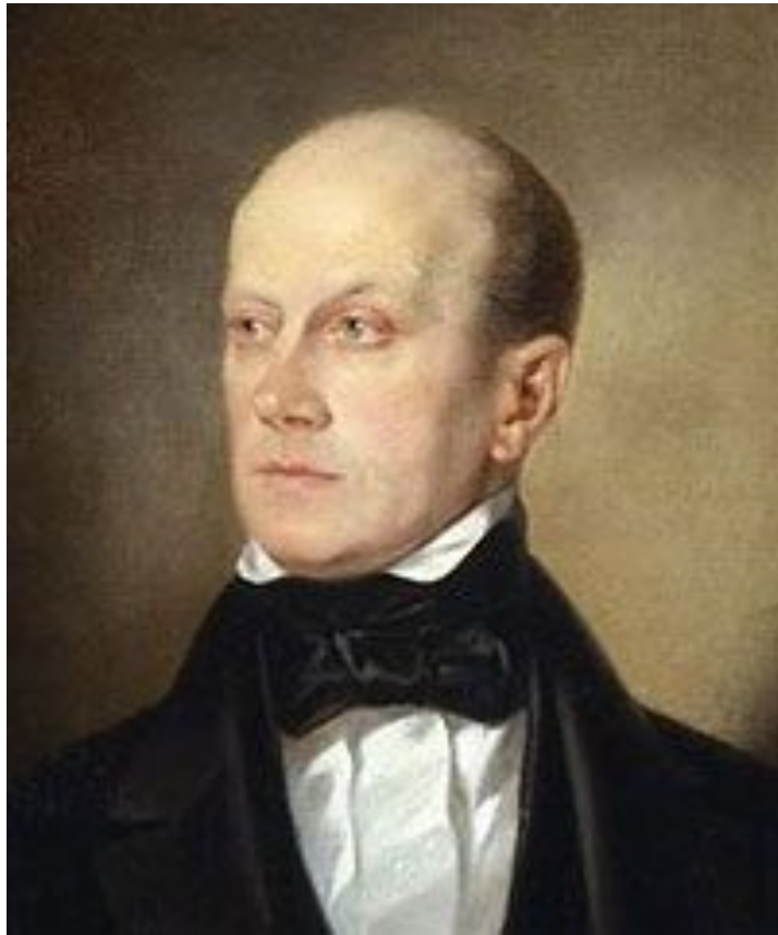
Пётр Яковлевич Чаадаев – великий русский философ

«Мы принадлежим к числу тех наций, которые как бы не входят в состав человечества, а существуют лишь для того, чтобы дать миру какой-нибудь важный урок»