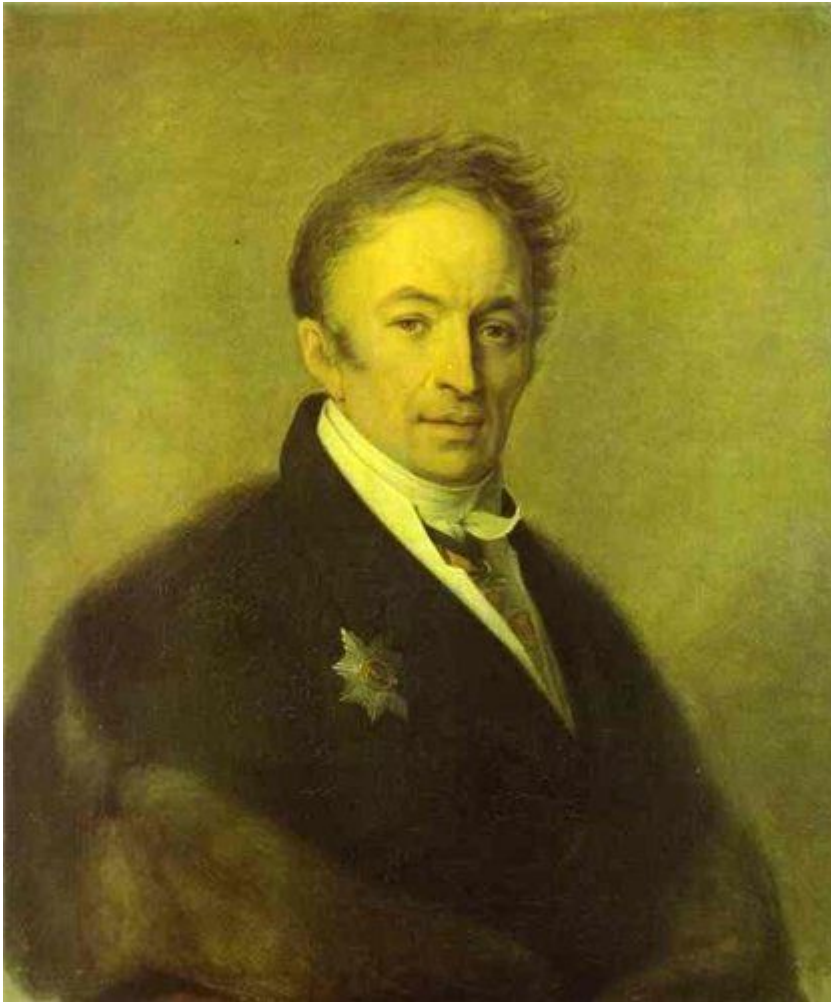
Николай Михайлович Карамзин – русский историк и писатель

«Смеяться, право, не грешно над тем, что кажется смешно»