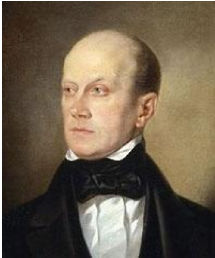
Пётр Яковлевич Чаадаев – великий русский философ

«Мы принадлежим к числу тех наций, которые как бы не входят в состав человечества, а существуют лишь для того, чтобы дать миру какой-нибудь важный урок»