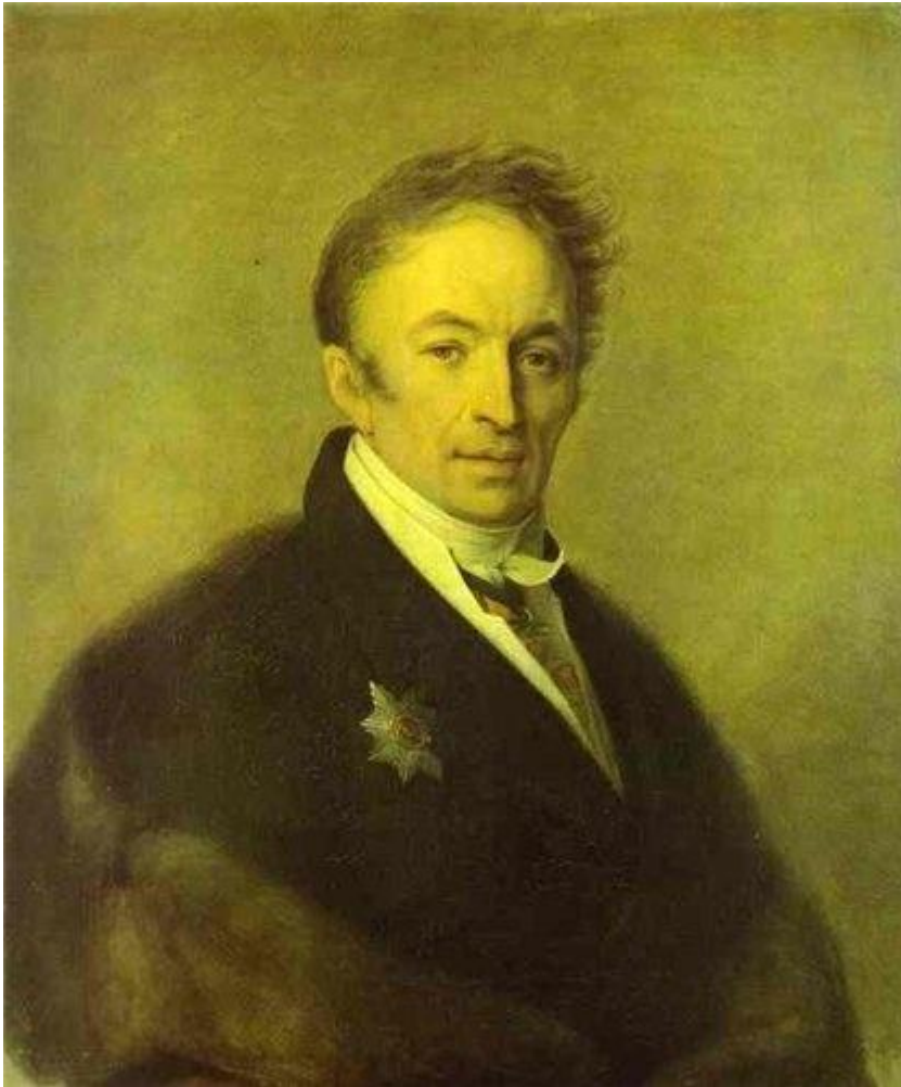
Николай Михайлович Карамзин – русский историк и писатель

«Смеяться, право, не грешно над тем, что кажется смешно»