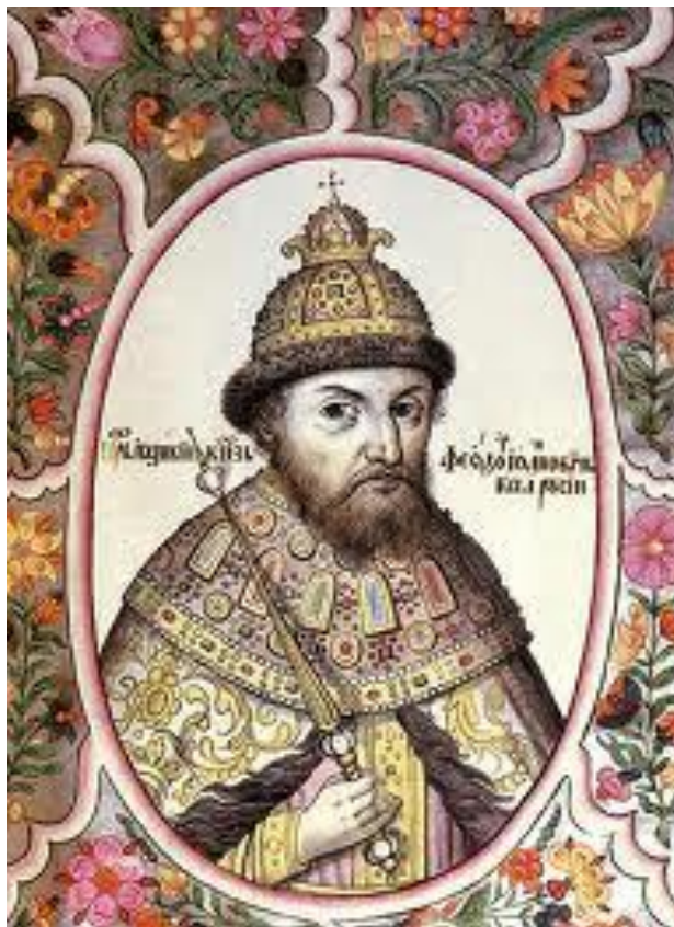
Федор Иванович (1584-1589 г.г.)