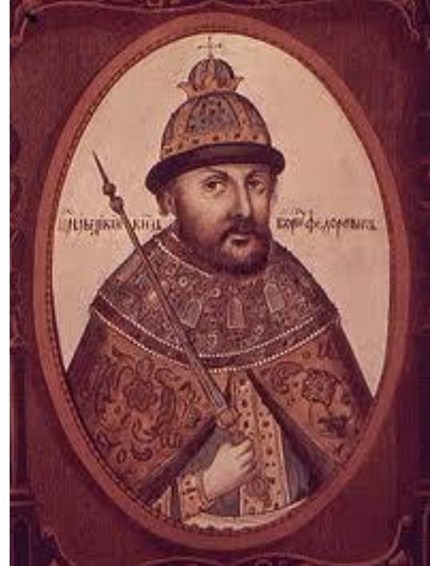
Борис Годунов (1589-1605г.г.)