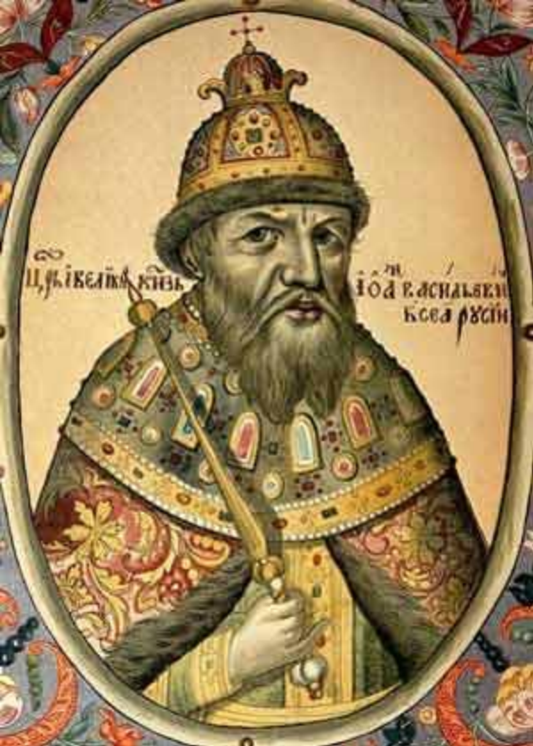
Иван IV Грозный (1530-1584 г.г.)