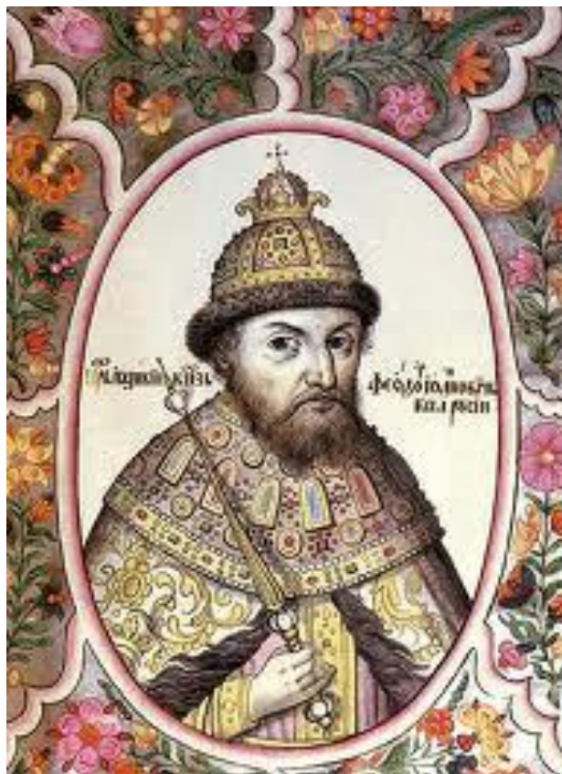
Федор Иванович (1584-1589 г.г.)