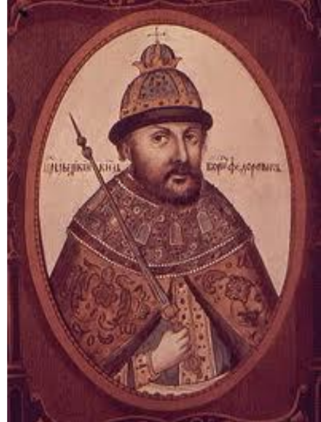
Борис Годунов (1589-1605г.г.)