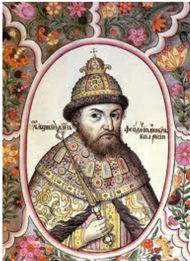
Федор Иванович (1584-1589 г.г.)