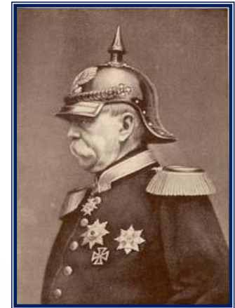
Отто фон Бисмарк

-запретил предоставление России кредитов, -повысил пошлины на ввоз российских товаров в Германию