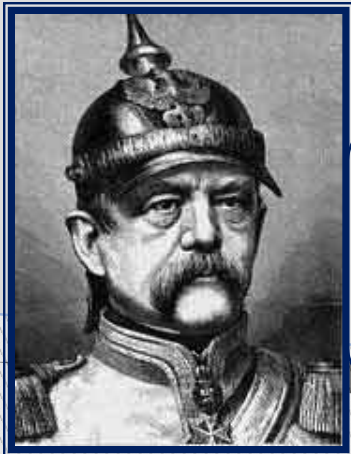
Отто фон Бисмарк

Германия считала Россию единственной консервативной силой в Европе, которая может остановить растущее демократическое движение в Европе.