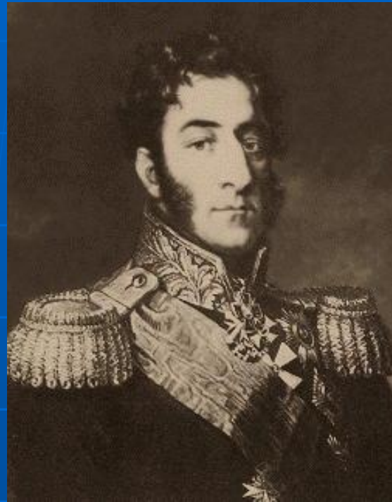
Генерал П.И. Багратион