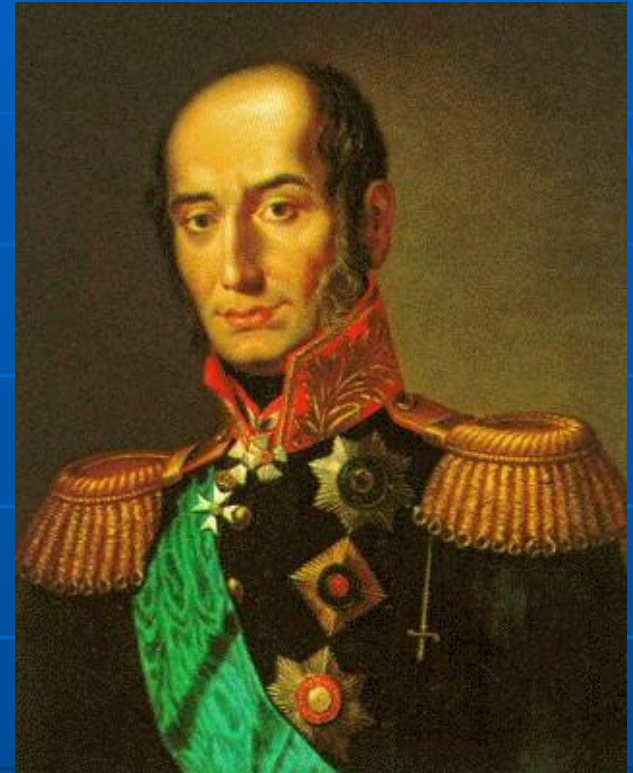
Генерал М.Б. Барклай-де-Толли