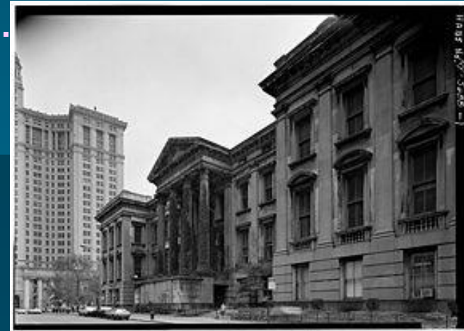
Одно трёхэтажное здание нью-йоркского окружного суда стоило дороже, чем вся Аляска