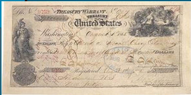
Чек, использовавшийся для покупки Аляски