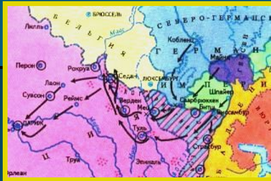
Карта франко-прусской войны