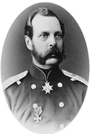
Александр II. Дагеротипный портрет. Середина 1860-х гг.