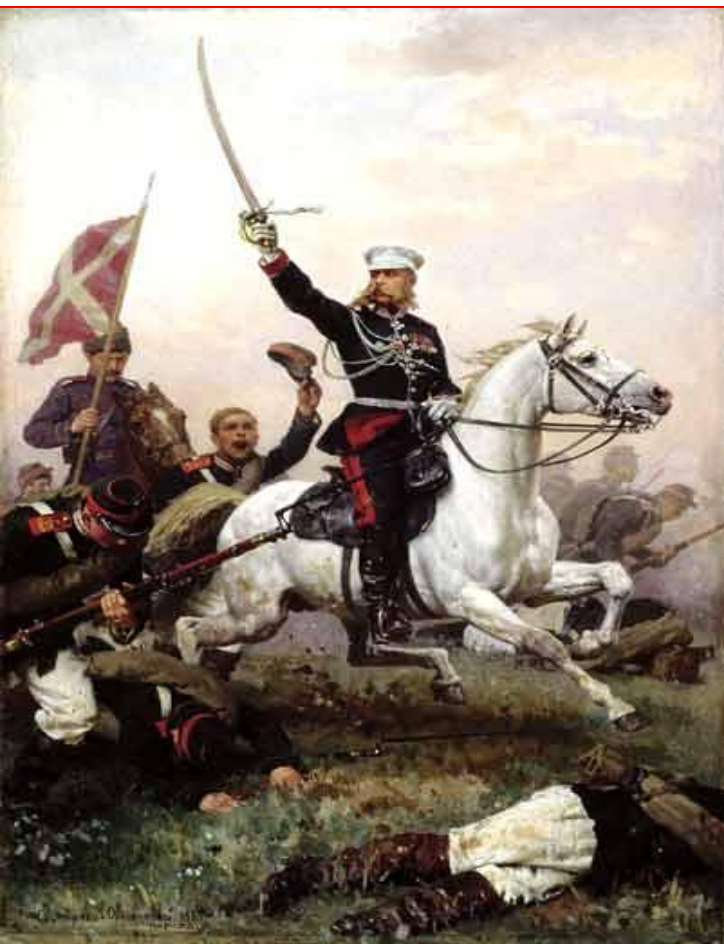
Генерал Скобелев ведет в атаку.

Опасаясь вмешательства Англии и Австро-Венгрии, отряд Гурко занял Софию, столицу Болгарии, а отряд генерала Скобелева уничтожив турецкие войска у Шипки, за несколько дней прорвался к Стамбулу 18 января 1878 г. остановившись у ворот города в селении Сан-Стефано.