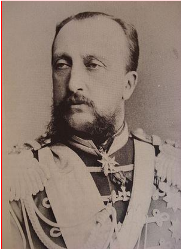
Главнокомандующий русской армией великий князь Николай Николаевич.

Летом 1875 г. начался Балканский кризис. Его причиной стало восстание в турецких провинциях Боснии и Герцеговине, вскоре к ней присоединились Сербия и Черногория. Командующим сербской армией стал генерал Черняев. На все призывы прекратить подавление восстаний Турция ответила молчанием. 12 апреля 1877 г. Россия объявила Турции войну.