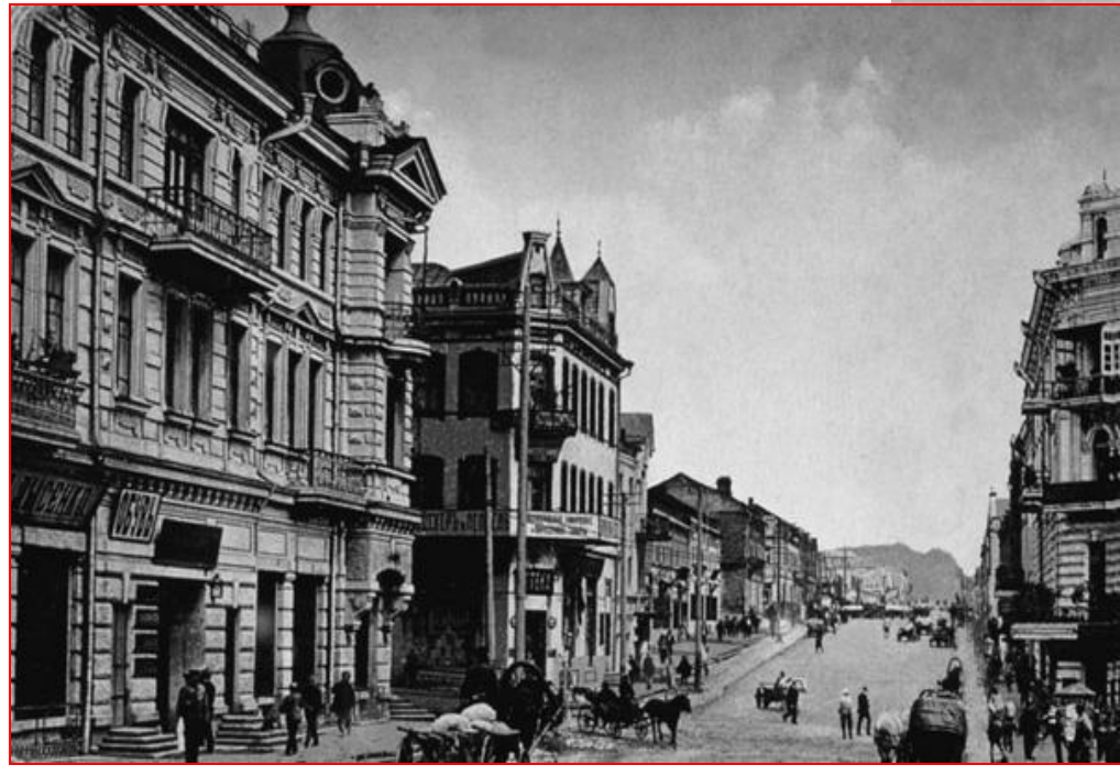
Владивосток в XIX веке

В результате долгих переговоров с Японией были установлены дипломатические отношения, а в 1875 г. после подписания Петербургского договора, за Россией был закреплён о. Сахалин, Японии отошли Курильские острова.