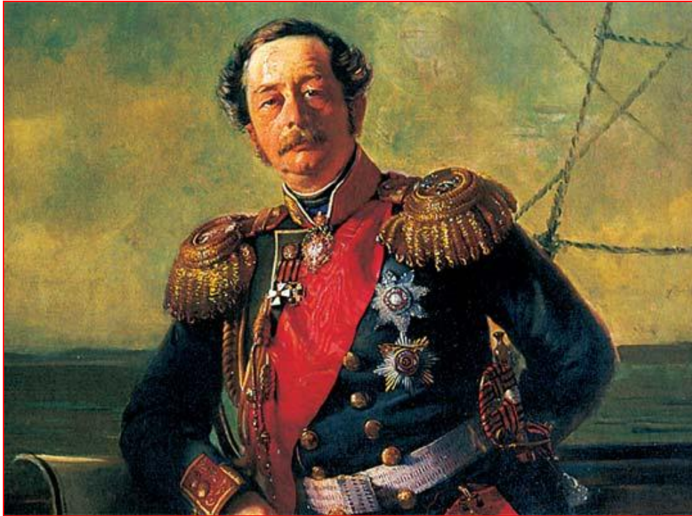
Генерал губернатор Восточной Сибири, граф Н. Муравьев-Амурский.