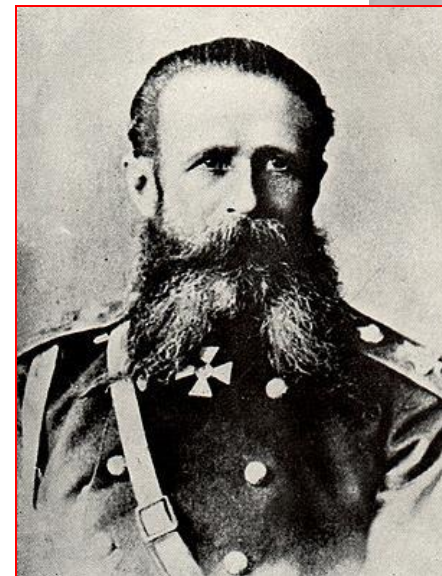
Генерал И. Гурко