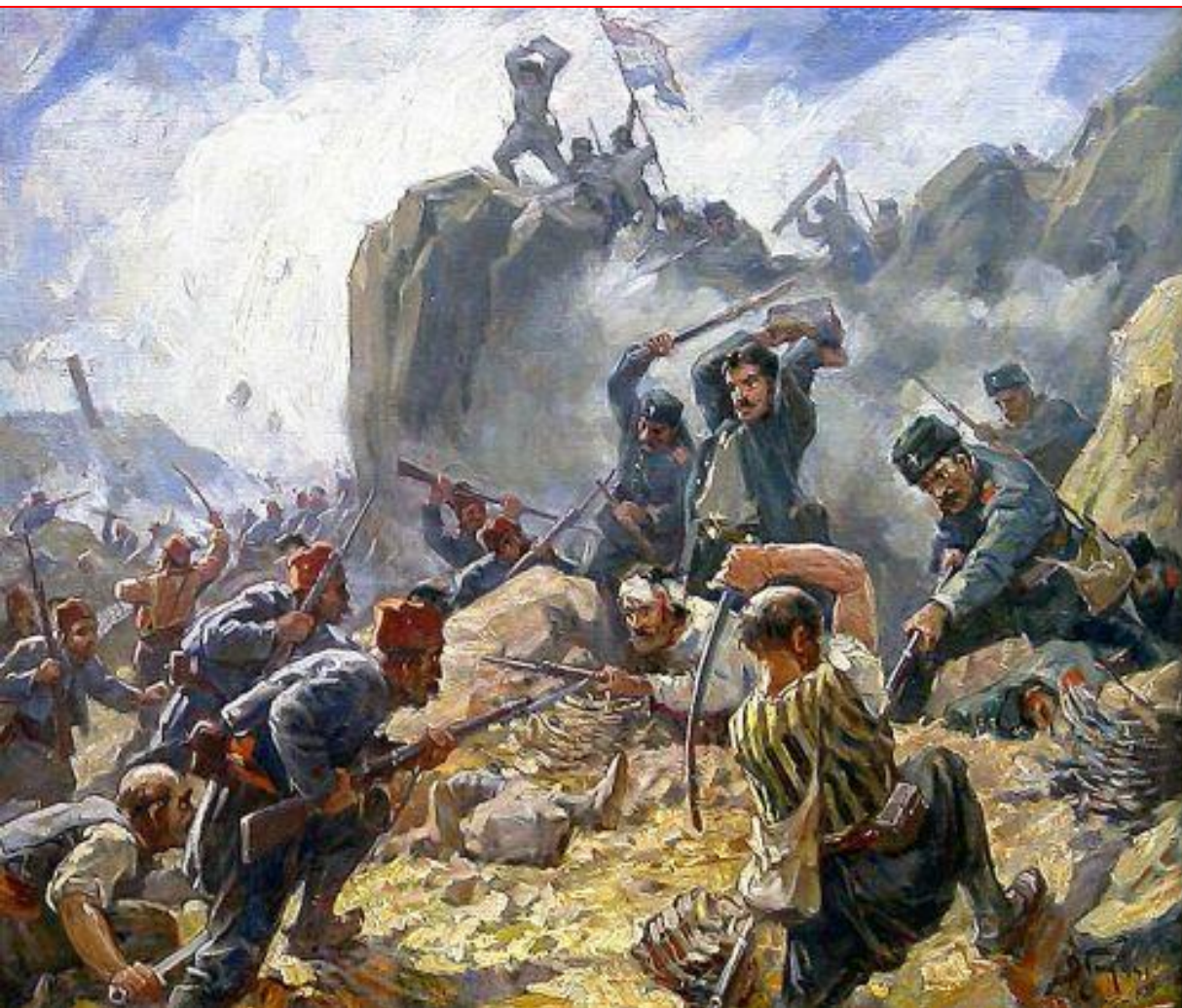
Бои за Шипку

В июне 1877 г. русские войска освободили Тырново, древнюю столицу Болгарии. 5 июля генерал Гурко захватил Шипкинский перевал, дорогу на Стамбул. Взять Шипку туркам так и не удалось.