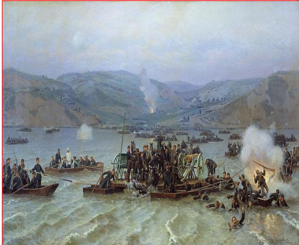
Переправа русской армии через Дунай у Зимницы 15 июня 1877 года