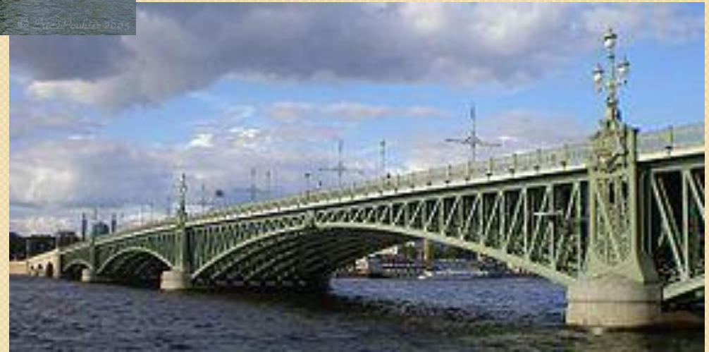
Троицкий мост через Неву