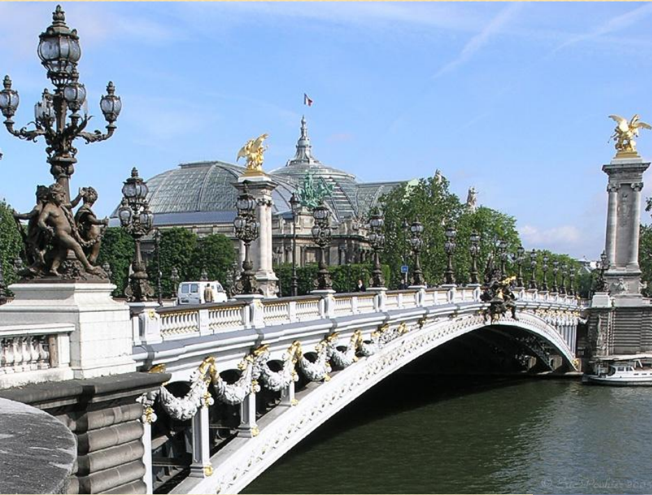
Мост Александра III в Париже