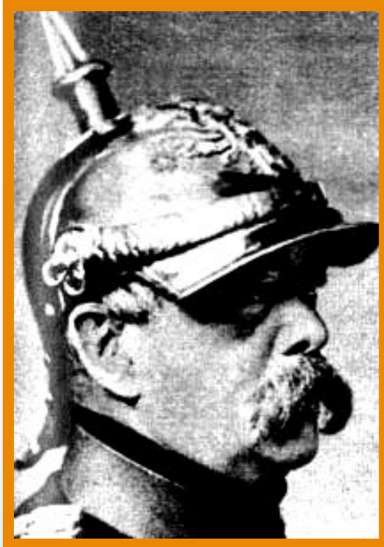
О. Фон Бисмарк

В союзе с Россией в н.80-х гг. были заинтересованы Германия и Франция.