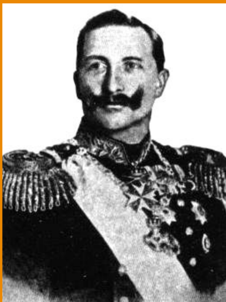
Германский император. Вильгельм I.

В 1887 г. отношения Германии и Франции обострились и лишь вмешательство Александра III, предотвратило войну. В ответ Германия начала таможенную войну.