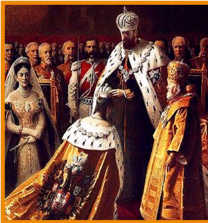
Коронация Александра III.

Александр III взял руководство внешней политикой в собственные руки. Ему помогал министр иностранных дел Н. Гирс. Важнейшие посты в министерстве сохранили дипломаты горчаковской школы.