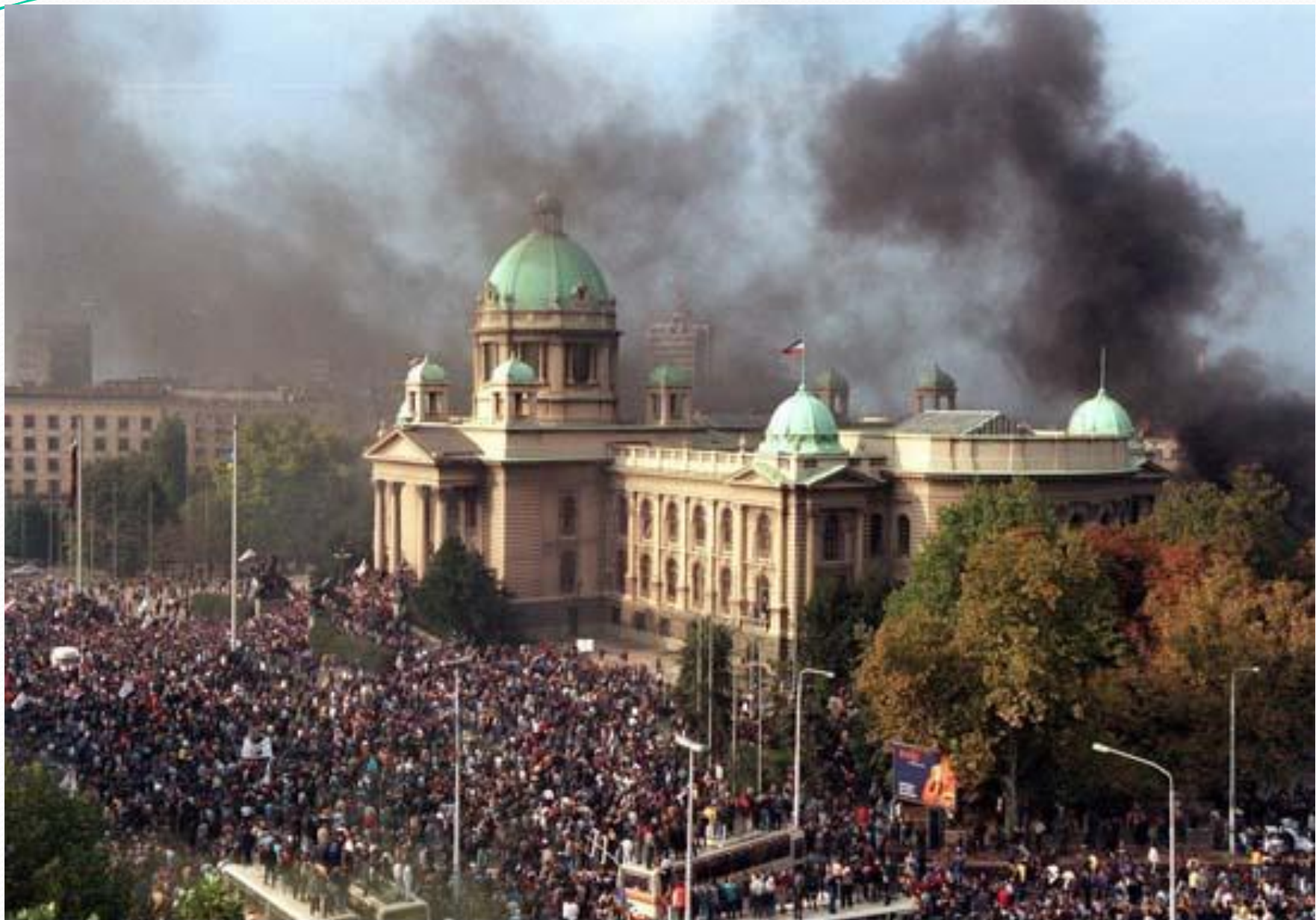
AP / Zeljko Safar, 2000