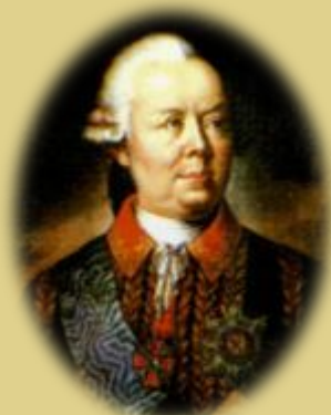
П. А. Румянцев

Турки оставили на поле сражения более 1000 чел., русские потеряли убитыми лишь 29 человек.