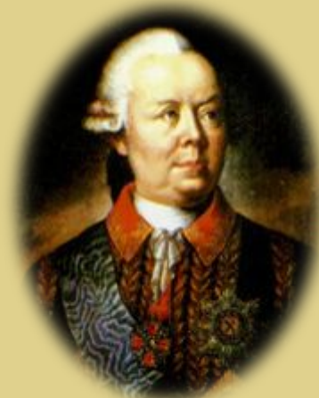
П. А. Румянцева

21 июля началось знаменитое сражение на реке Кагул, где 17-тысячному отряду Румянцева удалось разбить почти 80-тысячные силы противника.