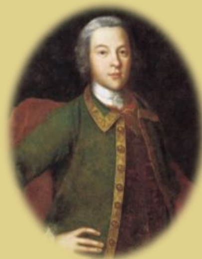
П. И. Панин

В июле - октябре 1770 г. русским войскам сдались крепости Измаил, Килия, Аккерман. В сентябре генерал П.И. Панин взял Бендеры.