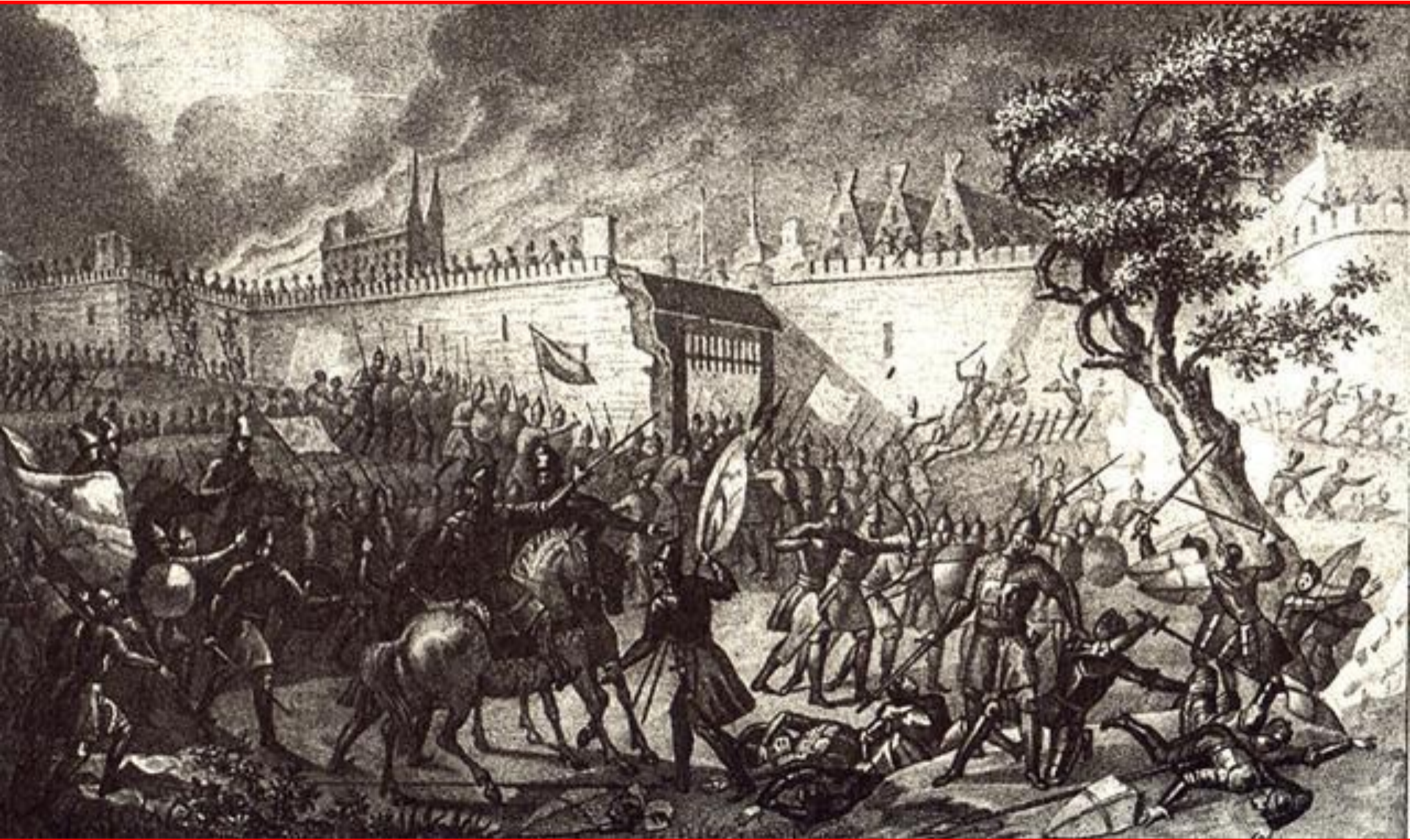
Русские войска штурмуют Нарву