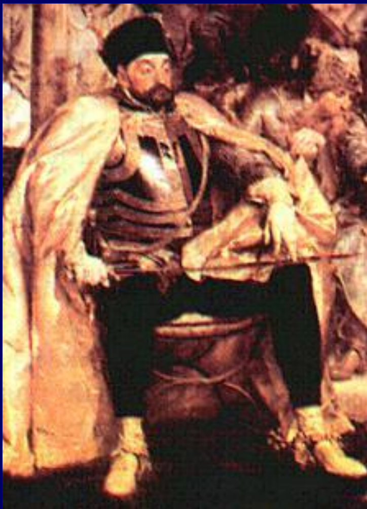
Я.Матейко «Стефан Баторий»

В 1569 г. произошло объединение (союз - уния) Польша и Литва в одно государство - Речь Посполитую.