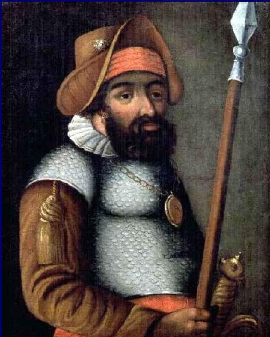
Портрет Ермака Тимофеевича

Уральские купцы Строгановы получили царские грамоты на владение землями в Сибири. Строгановы на свои средства набрали «охочих людей», сформировали отряд из казаков во главе с Ермаком Тимофеевичем . В 1581 году начался поход казаков в Сибирь.