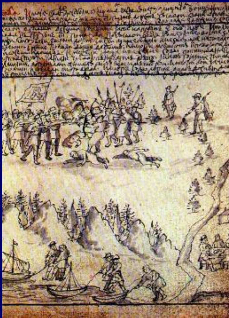
Казачи Ермака в Сибири Миниатюра XVII века.

В 1555 г. сибирский хан Едигер стал вассалом Москвы. Сибирь стала платить «ясак» - 1000 соборей в год. Купцы торговали с Сибирью, меняя на меха железо и хлеб.