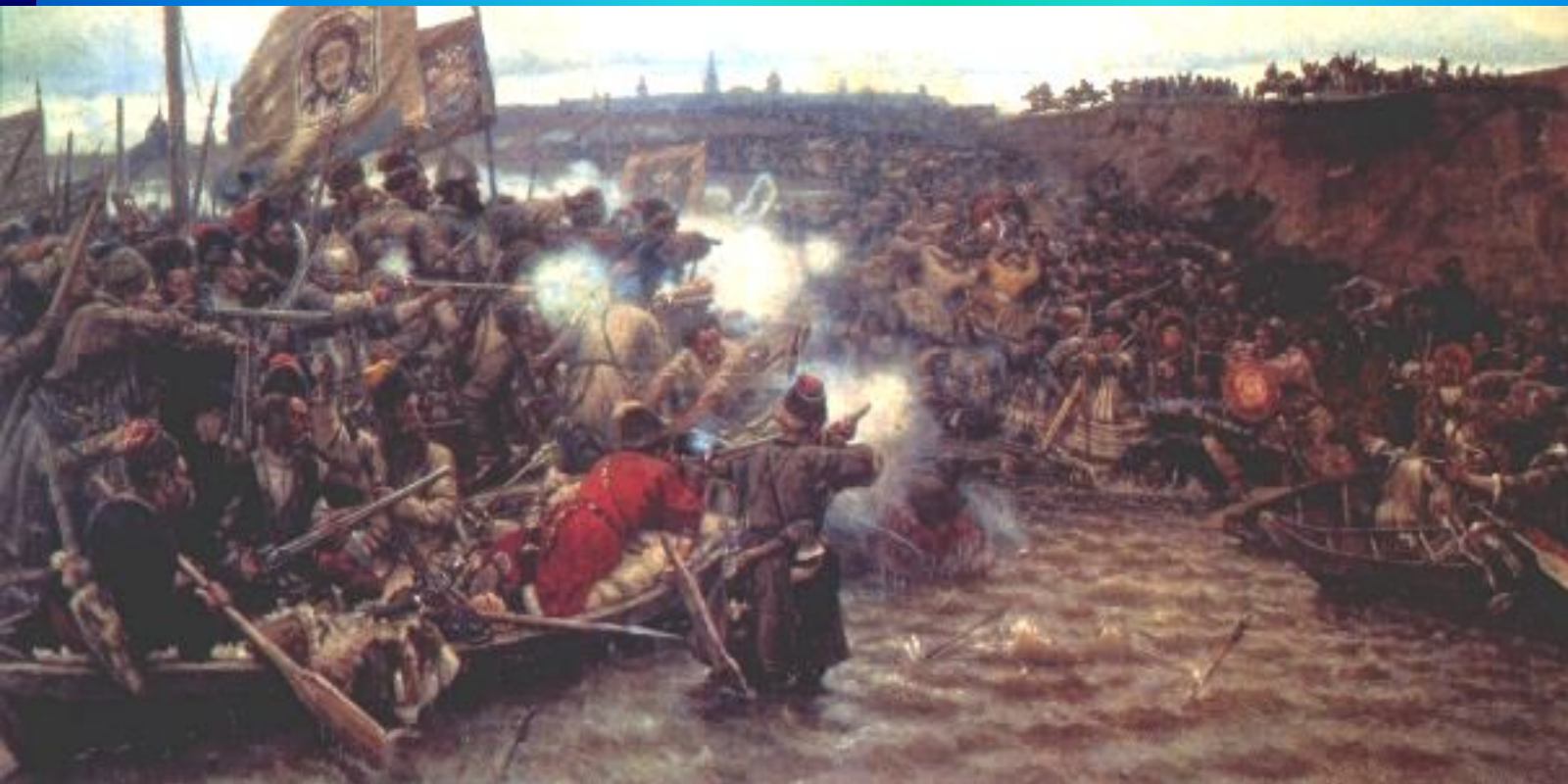
В.Суриков «Покорение Сибири Ермаком»

В. конце октября 1581 г казаки подошли к Кашлыку - столице хана Кучума. Воинство Кучума было разбито и разбежалось. Хан бежал на юг, в степи, откуда совершал набеги на русские отряды и остроги. После нескольких лет борьбы, продолжавшейся с переменным успехом, Сибирское ханство прекратило свое существование. Ермак погиб в 1585 г.