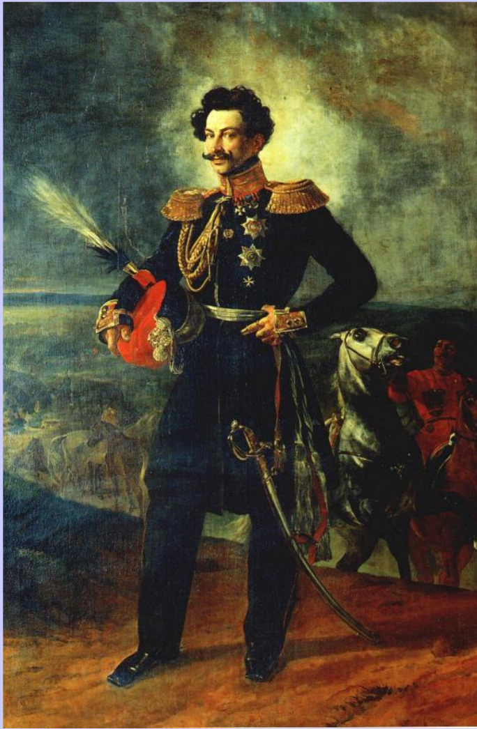
К.Брюллов. Граф В.А.Перовский

В 30-е гг.Россия установила протекторат над казахскими жузами,в этом районе началось строительство укреплений.Но на казахские земли претендовала Хива поддерживаемая англичанами.