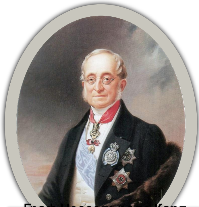
Граф Нессельроде Карл Васильевич (1780-1862), канцлер, Министр Иностранных дел (1816-1856).