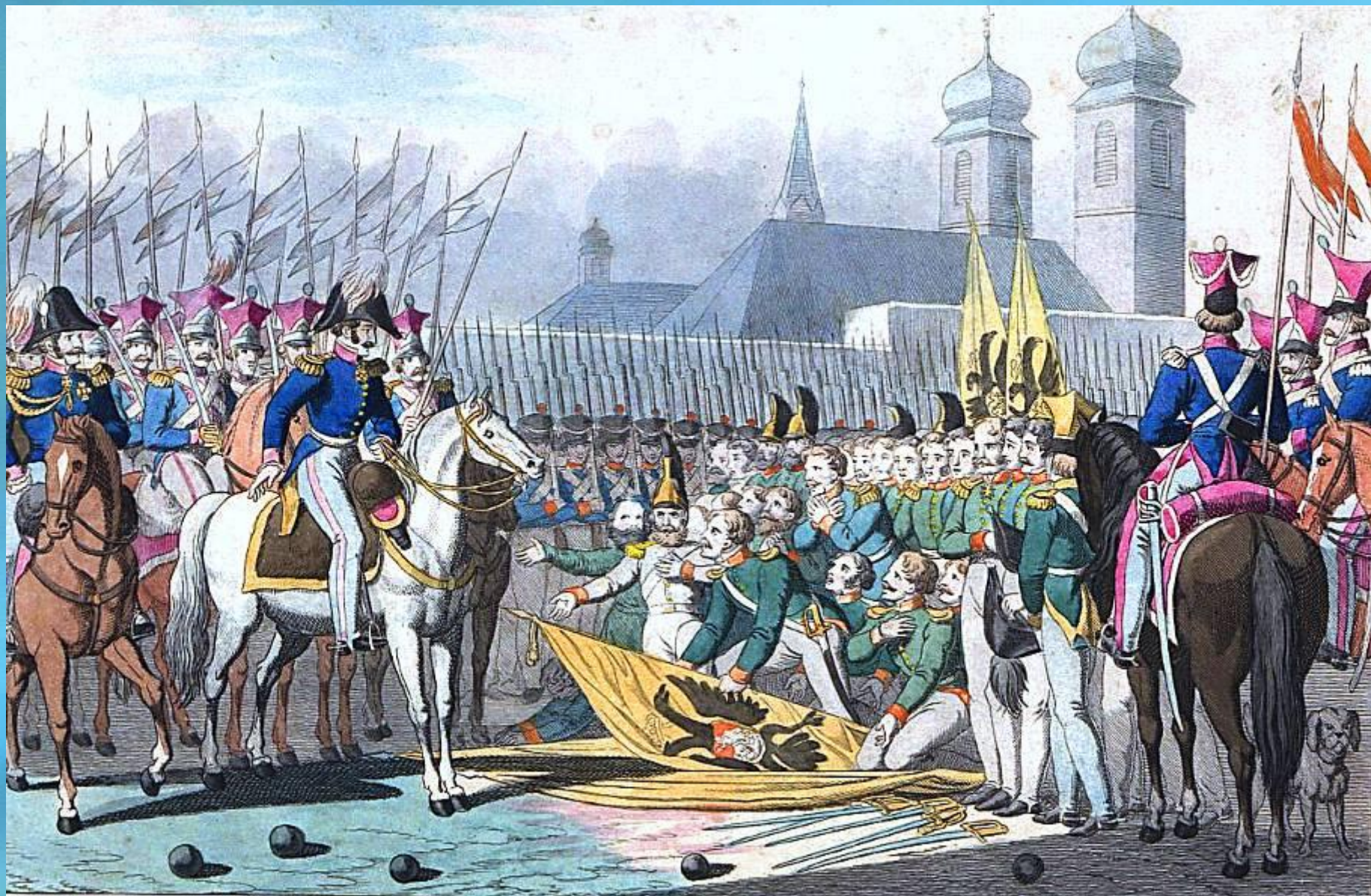
Низложение русских знамён после битвы около Вавра в 1831 году.