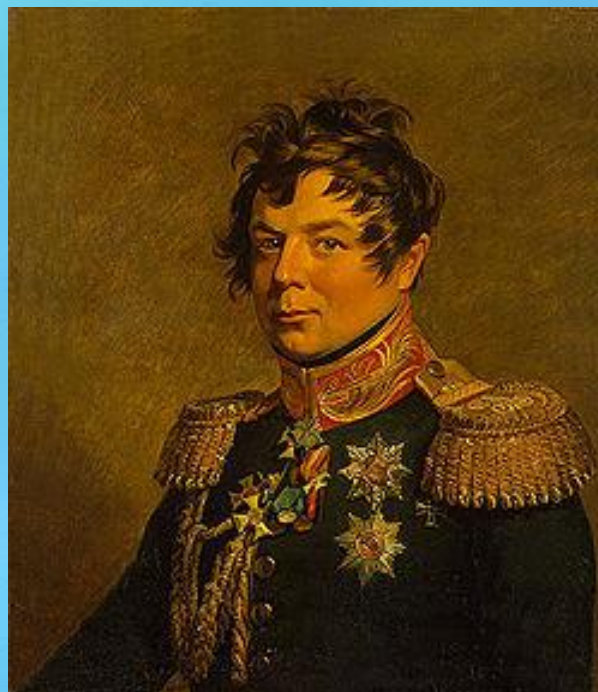
И. Дибич (Забалканский).