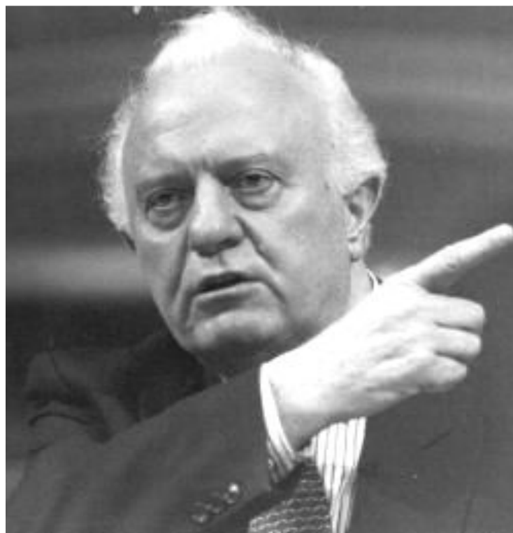
Министр иностранных дел СССР Э.А.Шеварнадзе.

Эти идеи были сформулированы в книге М.С.Горбачева «Перестройка и новое мышление для нашей страны и для всего мира».