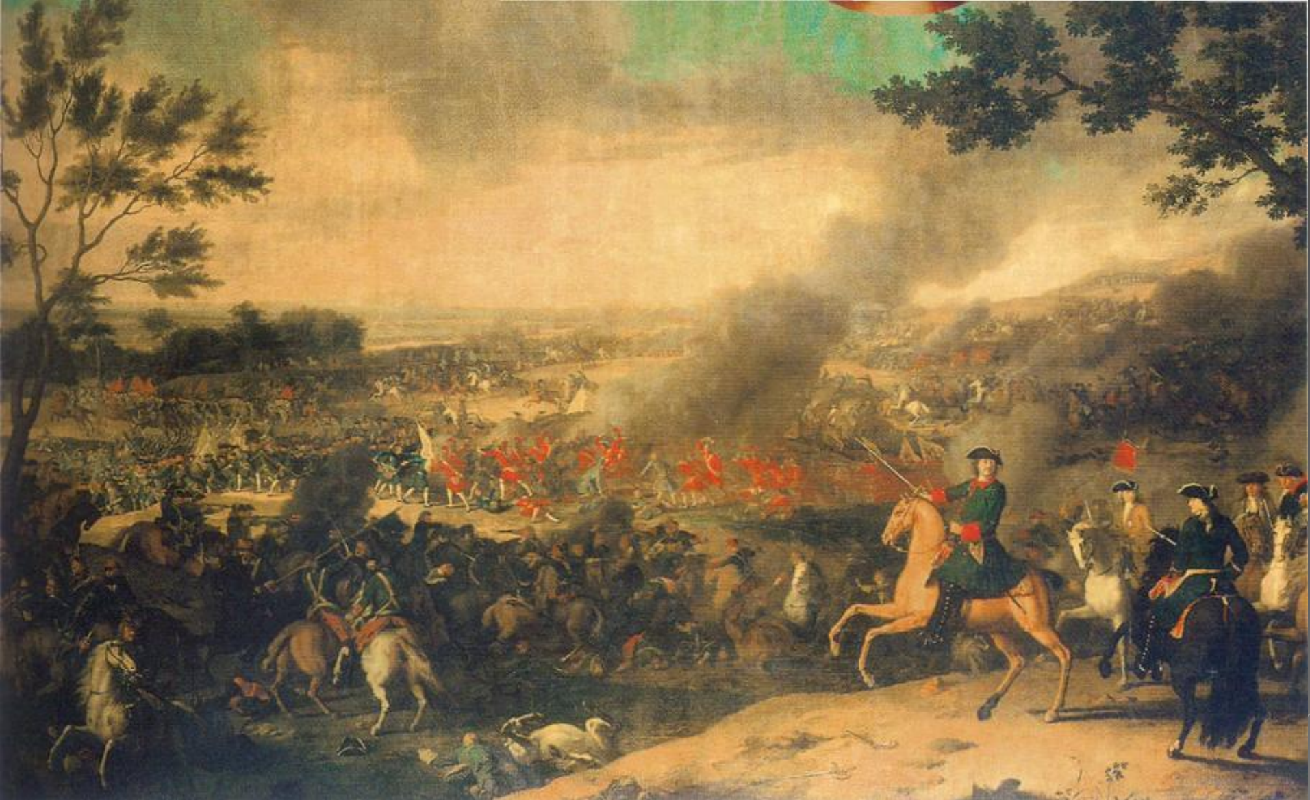
Луи Каравак (1684-1754). Пётр I в Полтавской битве. 1718г.