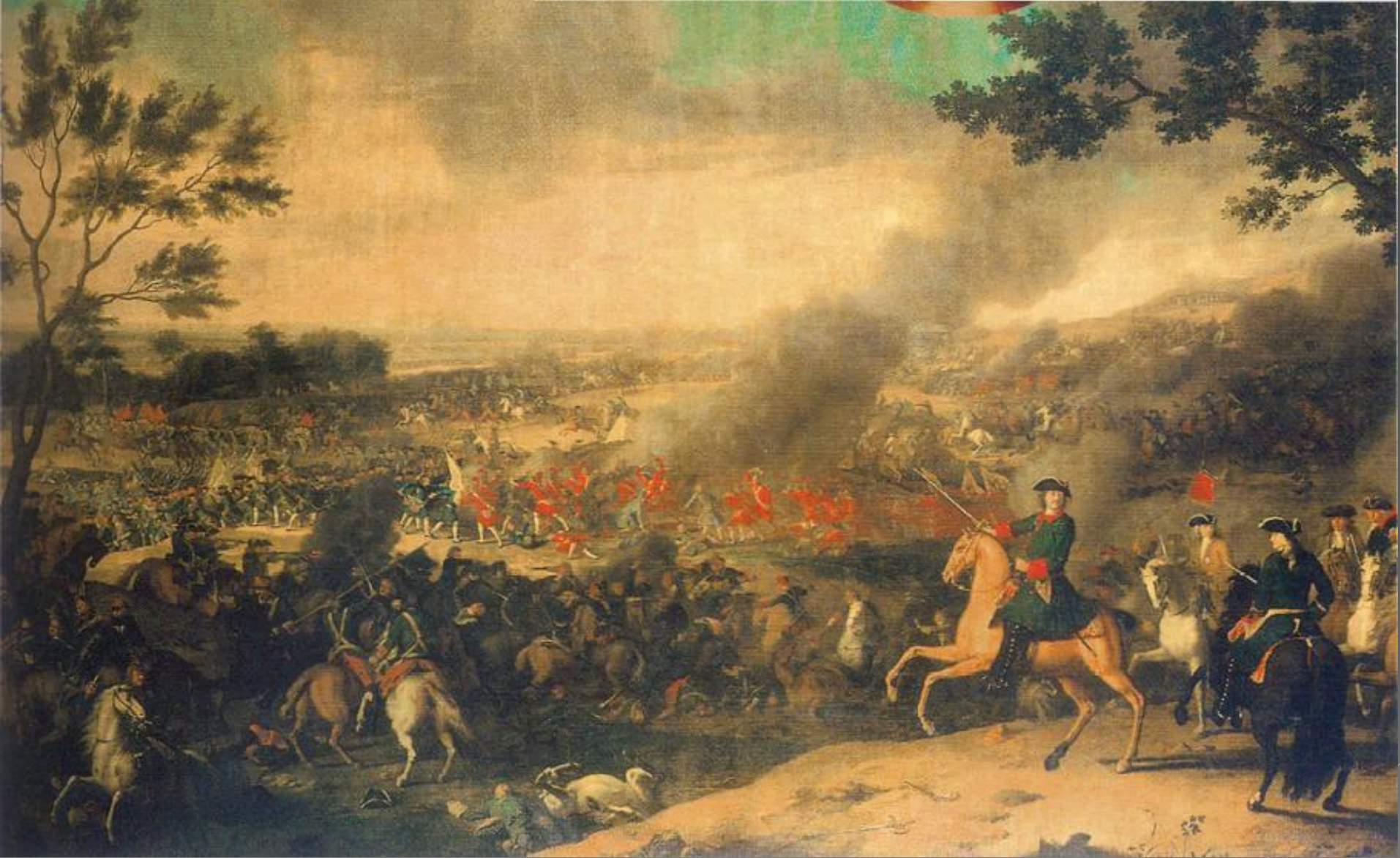
Луи Каравак (1684-1754). Пётр I в Полтавской битве. 1718г.