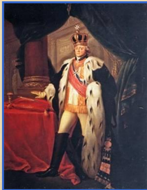
С. Тончи. Портрет Павла I

Предположите, с чего начал свою внешнюю политику Александр I ?