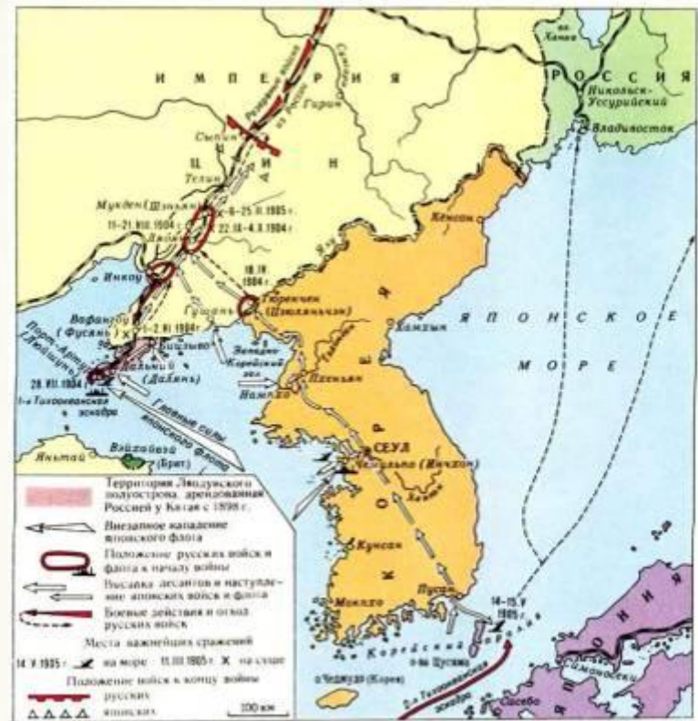
Русско-Японская война 1904-1905 гг.