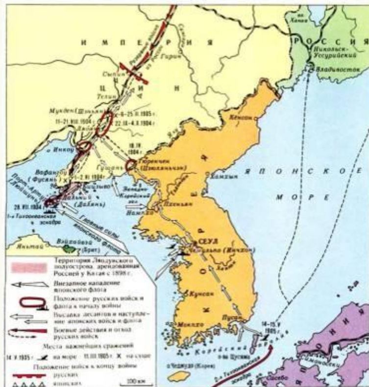
Русско-Японская война 1904-1905 гг.