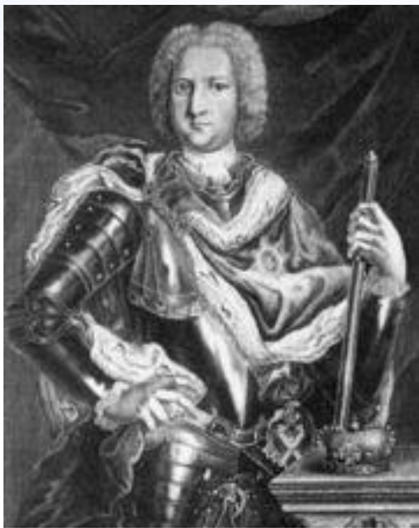
И.Соколов. Портрет герцога Э.Н.Вирона.