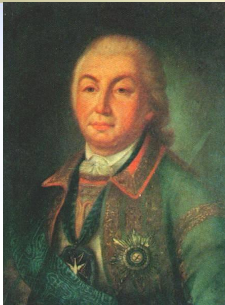
П.С.Салтыков – командующий русской армии с 1759 г.