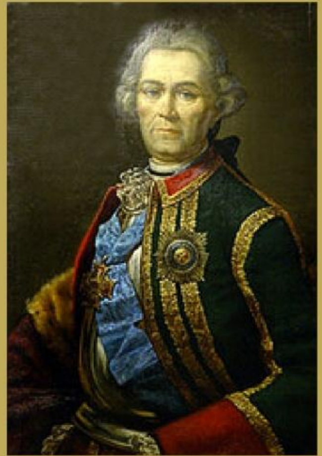
Генерал-фельдмаршал Христофор Антонович Миних

Христофор Антонович Миних Генерал-фельдмаршал